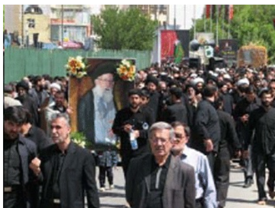
تصاویری از مراسم قافله عزاداری شهادت حضرت زهرا سلام الله علیها در ۹۰/۲/۱۶ از مجموعه فرهنگی مذهبی قائمیه اصفهان (خیابان مسجد سید) به سمت مرکز تخصصی حضرت ولیعصر (عج) (خیابان چهار باغ پائین)