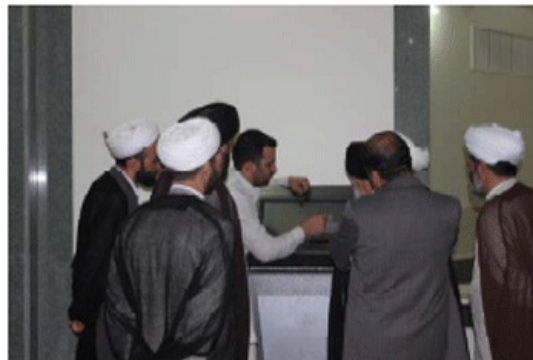
سامانه نرم افزار و سخت افزار کیوسک هوشمند کوثر