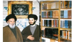
حضرت آیت الله العظمی آية الله الامام زین العابدین