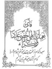
تصویر شماره ۸