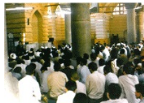
تصویر شماره ۳

۱۰- در ضمن حسن خلق و چهره متبسم، به علت وقار و هیبتی که حاکم بر شخصیت شان بود جلسات درس از متانت و آرامش برخوردار بود و حاضرین جلسه درس، رعایت اهمیت محفل را می نمودند.