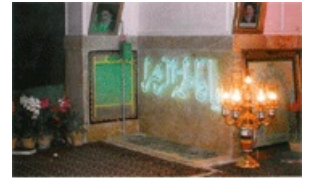
تصویر شماره ۳۶