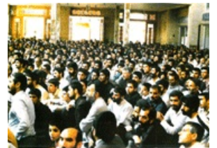
تصویر شماره ۱۷