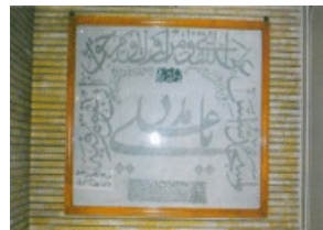
تصویر شماره ۴