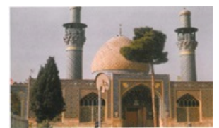
تصویر شماره ۳۷