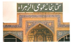
نمای از صحنه سید بابا محمد علی متقا، و تابوتی کتابخانه از راه ۱۶