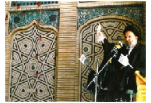
تصویر شماره ۱۶

شایسته ای یا خدمتی به خلق خدا انجام می دادند، با این ابزار موثر، آن ها را شیرین کام نسبت به کارهای خیر و توجه به خدا و دستورات الهی می نمودند.