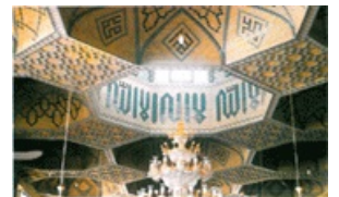
نمای سقف شرفستان سید بابا محمد علی متقا بسجده لای.