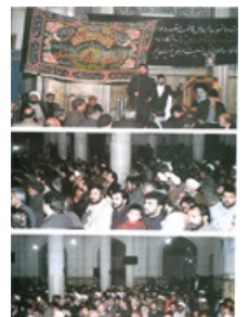
تصویر شماره ۴۴