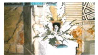
کشی سیدی بنی هاشم پرده پرده آیت الله العظمی امام زین العابدین