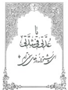
تصویر شماره ۱۰