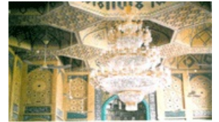
نمای داخل شهبان مسجد بابا محمد علی شاه اصفهانی.