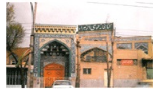
سرمد تویی آرامگاه سید بابا محمد علی متقا بسجده لای.

های مادی و معنوی آن استاد عالیقدر بهره مند می گردیدند و در مسائل عمومی و اجتماعی، پشتیبانی های آن بزرگمرد، قابل توجه به حساب می آمد.