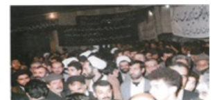
تصویر شماره ۳۸