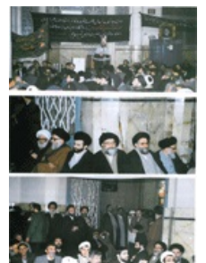
تصویر شماره ۴۳

در دو مجلس یاد شده نیز، علاوه بر علماء و فضلاء حوزه ی علمیه ی قم، جمعی از علاقمندان و بستگان مرحوم آیت الله امامی، از اصفهان شرکت جستند و به سوگواری پرداختند.