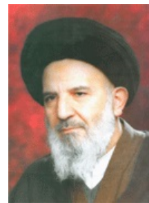
تصویر شماره ۱

عالم عامل و مجاهد بارع و دانشمند جامع، استاد حوزه علمیه و سنگردار آثار دینیه، چهره درخشان عالم خطابه و منبر، و شمع فروزان مسجد و محراب، حجت الاسلام و المسلمین، مرحوم آیت الله حاج سید فقیه امامی، در تاریخ ۱۷ ربیع الاول ۱۳۵۲ قمری برابر با سال ۱۳۱۲ شمسی، همزمان با سالروز میلاد مقدس و مبارک خاتم النبیین و اشرف الرسل، حضرت محمد بن عبدالله «صلى الله عليه و آله»، و همچنین سالروز میلاد میمون و مبارک پیشوای ششم شیعیان جهان، امام جعفر بن محمد الصادق «علیه السلام»،