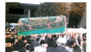
یکشنبه ۱۳ آبان ماه ۱۳۹۰، مراسم عزاداری در شهر اصفهان