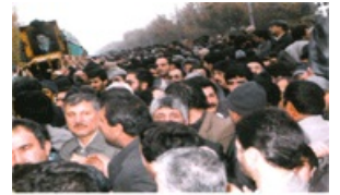
یکشنبه ۱۳ آبان ماه ۱۳۹۰، مراسم عزاداری در شهر اصفهان

حالت معنوی و روحانی بسیار جالبی بر جمعیت مستولی گردید و شیفتگان و دوستداران امام زمان عجل الله فرجه با اشک های ریزان، به دعا و استغاثه پرداختند و از پیشگاه خداوند متعال تقاضای تعجیل در ظهور و فرج آن امام منتظر (عج) نمودند.