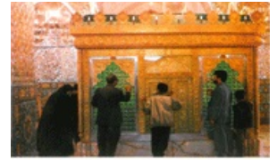
تصویر شماره ۳۵