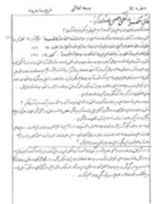
تصویر شماره ۹