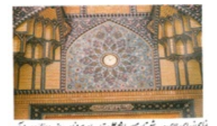
نمای از برای بالای صحنه شرفستان سید بابا محمد علی متقا، ساخته نام و نام خانوادگی آن نام مبارک است و پیکر حضرت عزادار بابای آن