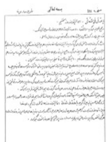
تصویر شماره ۱۱