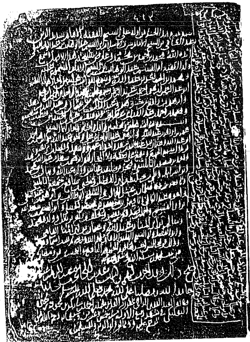
صورة من السماعات على آخر الجزء الرابع عشر من «الإبانة» الثالث من الرد على الجهمية «الأصل»