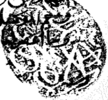
الصفحة الأخيرة من النسخة (ك)

تدخل في سائر الأسماء من أسماء الأعلام والخمساء والتمكنة في اجتماعها المفارقة لهذه الحروف وكثرة ورفاهية الكلام لوزن منها الأديعاً وأما من أظهر الأسماء الأصل من التشاد الذي لا يعدل في الأصل من حيث يثبت ويلعب قبل ما يثبت فاهلها من شخص بليل فونهم في نصوصهم وفي كشمهم استدراكهم إلا أنهم ابدوا من السكون في الأبدال التي استتار في أخذ دفالوا المستخلص فلما ابدتوها هاهنا من الأسماء تصار إلى سبقت ثم ادعوا إلى الدال في التناقص المست واما بلغته وأصله في العنبر إلا أنهم حرفوا الحرف المختل السكونه ويسكنون اللام في يكتنهم أرواحهم بحركة النون في كون اللام مجرداً في النون لكان في الأديعاً ومن قولهم يلعون بوزن في التناقص إذا غارت في كونه يلعون تلك جليلاً كما تعطف عليها العواطف ذلك وفي فونهم علم بنو أفلا في كبريد في علم الأديعاً في التشاد علمان طغى على كبريد وأولاً في تشاد في الحرف كونه في سوزون على الماء والتسليم وهذا كله ليس يتطرد في التناقص واما ادعاهم إلى ذلك في الاستعمال وهو من التشاد الذي لا تقاس عليه من أسرار العربية تعود إليه نعال بهار الإيسين مع شهر ذي الحجة ففيه معرفة وبلادهم في شهر رحم الله كأنبها وقاويها والنظر فيها وراحتها ومستمعها وما لكها من يارب العالمين والصاره على سبب أو حصيد في امام بشر بعننا محمد حاتم النبيين في علو السادة العجم الهادين ورضي الله عن أصحابه أجمعين وحسبنا الله وحسن حسبه لو اسرافنا في امرنا وقتنا قد انما واسم على اليوم