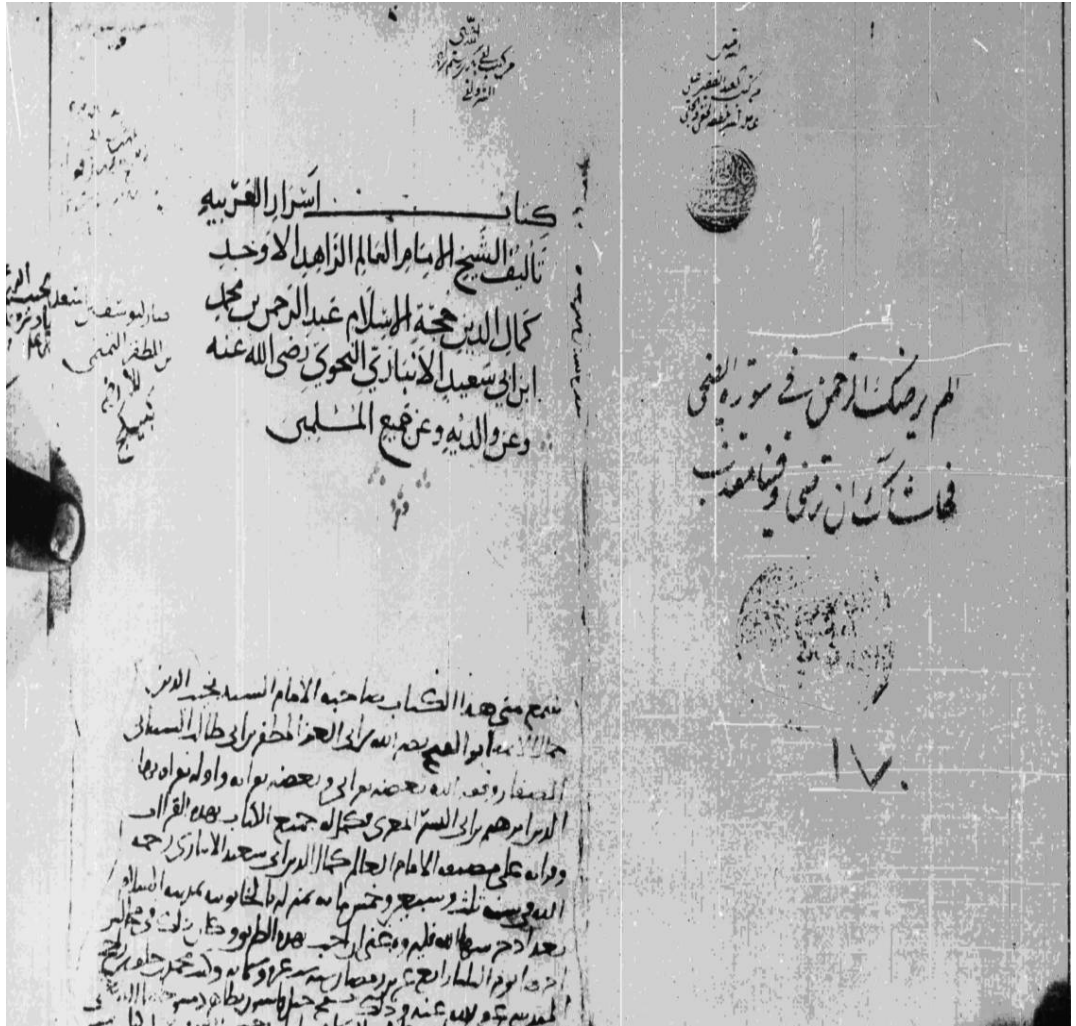
غلاف النسخة (أ) ويظهر عليه الإجازة