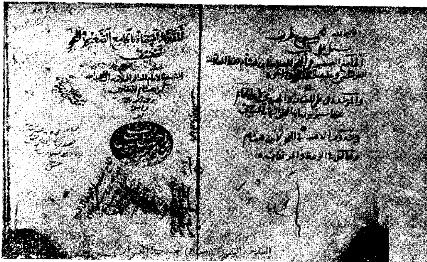
( الجامع الصغير ) صفحة العنوان من النسخة اتيمورية ( الأصل )