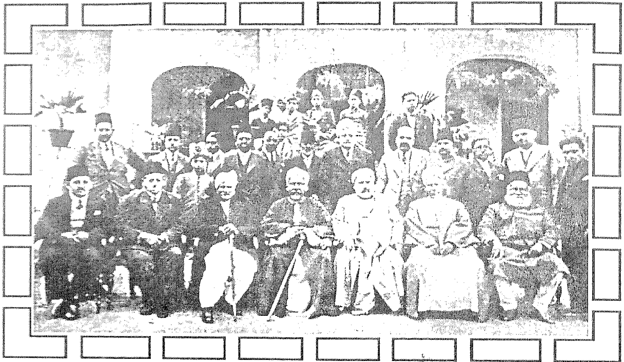
إقبال والوفد المصرى الأزهرى فى مدينة لاهور عام ١٣٥٦هـ / ١٩٣٧م