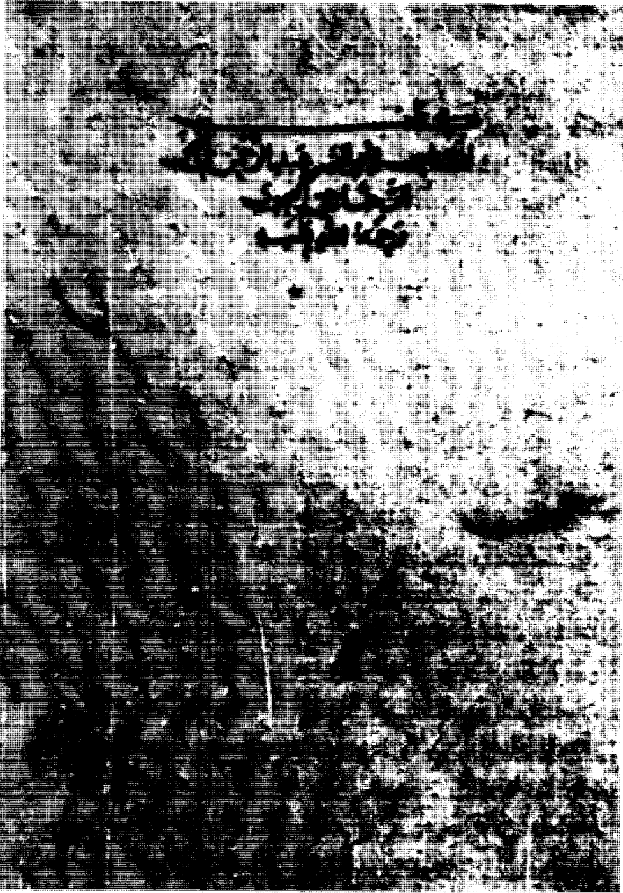
صورة الصفحة الأولى من كتاب اللامات وفيها عنوان الكتاب واسم المؤلف