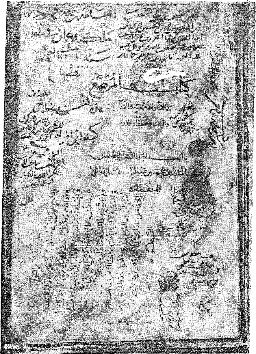
الصفحة التي تحمل العنوان من نسخة الأوقاف