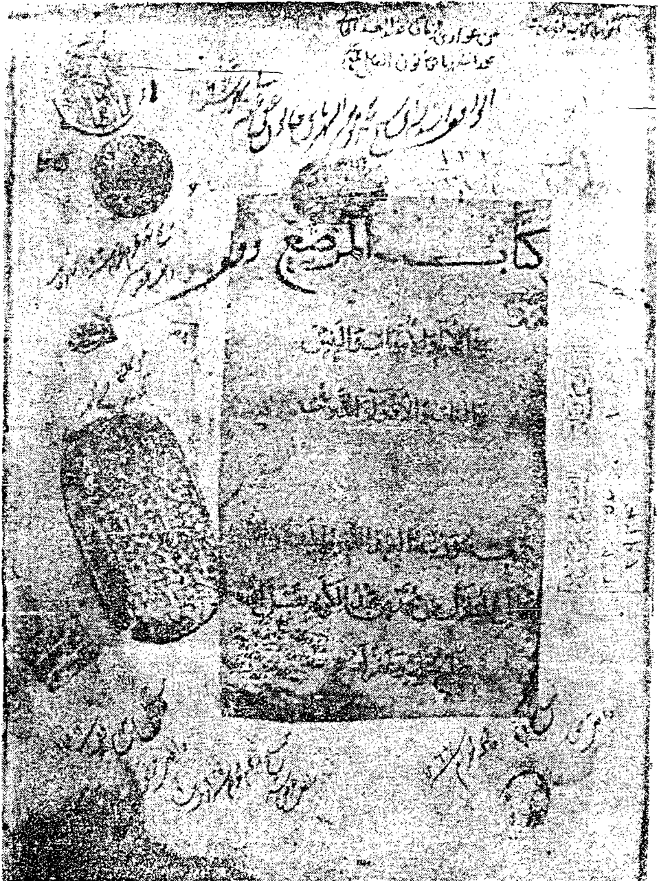
الصفحة الأولى من نسخة مشهد