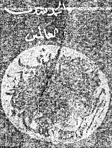
اللوحة الأخيرة من نسخة « ق »

لذاتة قد صوح الحصر من راء ، اكل اللحم والعطارة هو لها في الحظ ما هو ارا من الحصر وان اذ نبت طلنت رطابها ت حذر لا حتى يعيون عليها ، كمن الله سلفها اذ مر اذ ان لا اين منقها اذ ما سكت من فضل حسنها من اقل ولم يوجد له حصر على فاشقة اللام الف وقال ايضا قلت عذاة السب اذ قيل ، ان اني احسبها اشاك باليها ان ان ما نبت كي ، قال بها على تروا دي فقلت عندي ان تشارفة ، لا تفيد العين لها تاس مرات حم وحم وحم ، كذا الطور طورا شم الغاسية بارب واسمع واسمع ، كمن الالسدي العافية تم اليراث اذ حصر