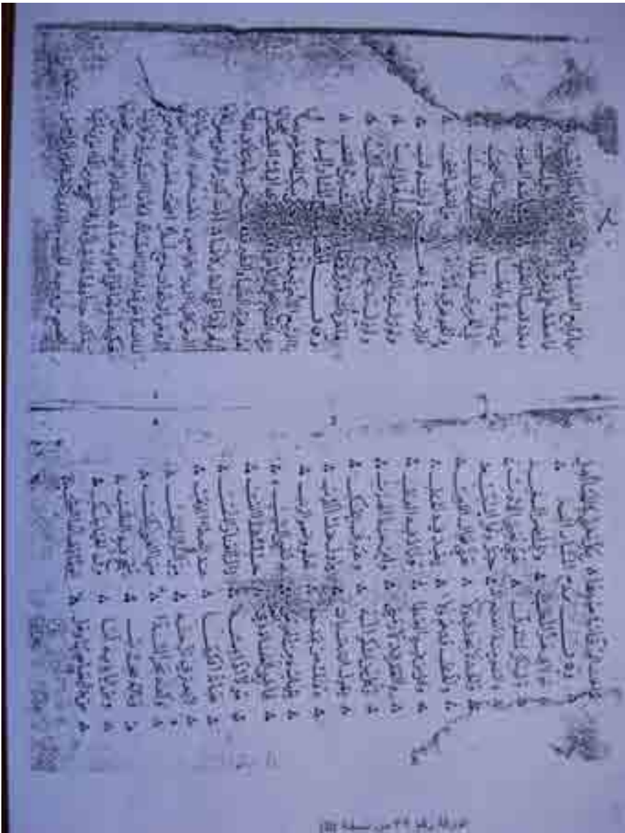
الورقة رقم ٢٢ من نسخة (ب)