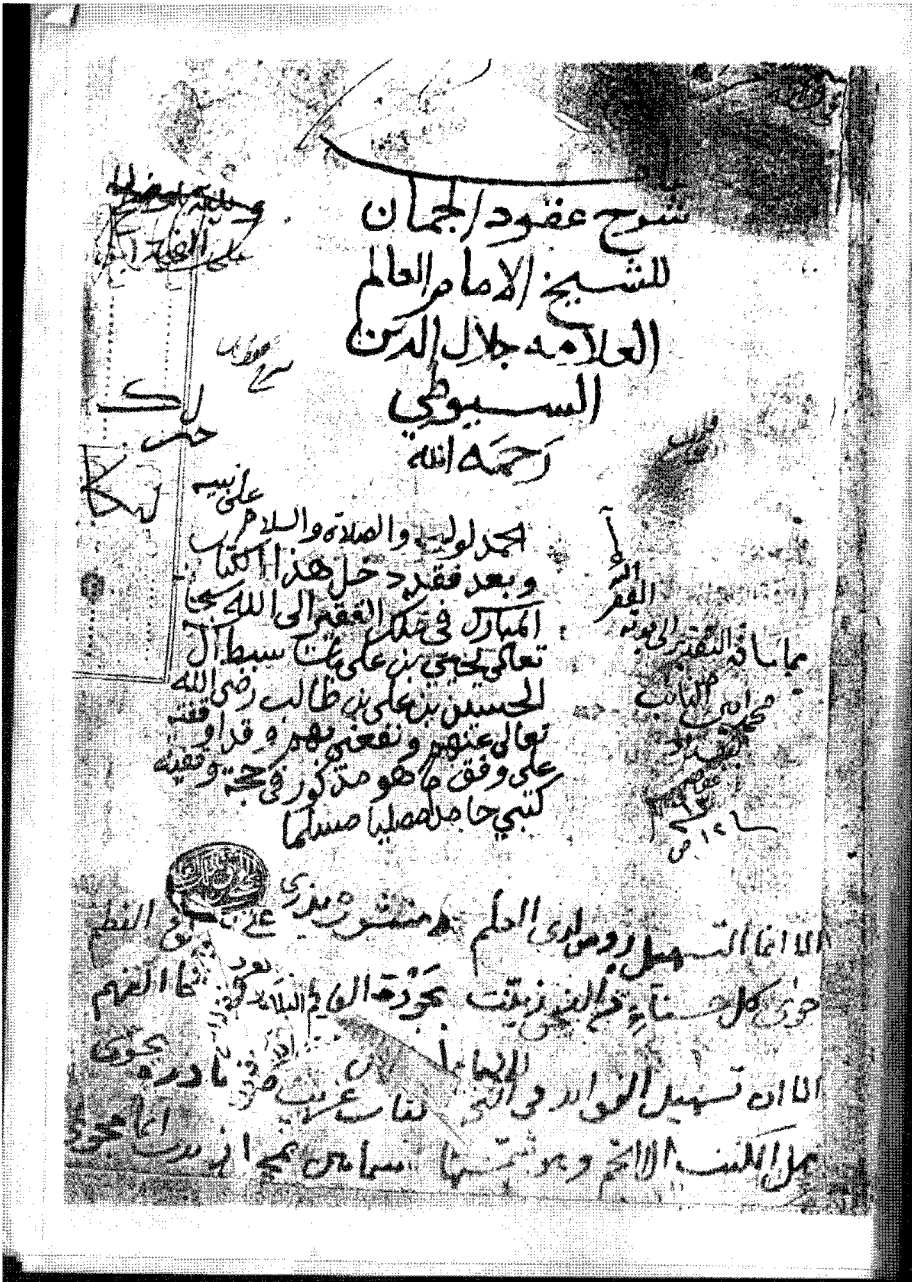
واجهه النسخة ق