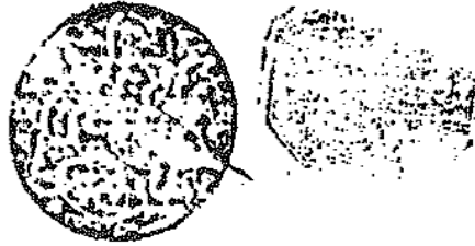
صورة الورقة الأخيرة من نسخة الظاهرية (ظ)

بن أحمد الأردستاني وقطع الأرباب من الفلك الراثي والتجريد للشيخ الجرائي والمتنب الناعوري ولاقصى القريب في صناعة الأديب لزين الدين التنوخي المغربي واليديع لقاضي القضاة شهاب الدين قاضي القضاة شمس الدين الخريزي والتلخيص لقاضي القضاة جلال الدين القزويني خليل الجامع بدشتن المروسي وهو آخر ما صنف في عصره قال السعيد الموزني صفي الدين عبد العزيز وأكثر هذه الكتب موجود عندني وتختلف عن غيرها ما لم اضطر إلى مطالعته لقله اشتغاره ثم وكل الحمد لله وجهه سابع عشر رجب الأصيب الحرام الفرد المبارك من سنة وستين وثمانين وصالوة على خير خلقه محمد وآله من كلام الأبي عمرو الجاحظ لا تصح الناس إلا بالتأديب ليس إلا بالامر والنهي والامر والنهي غير ناجعين فيهم إلا بالترغيب والترهيب والرغبة والرهبه أصلان لكل تدبير وعليهما مدار كل سياسة عظمت فاجعلها مثلكما الذي تحمدي عليه