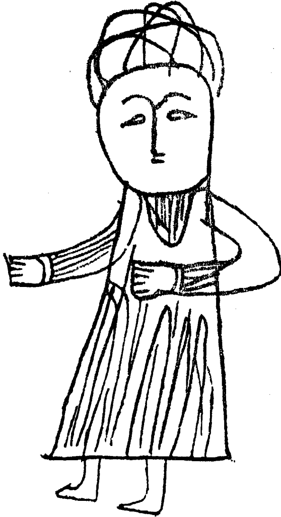
صورة أوميرس كما جاءت في مخطوطة برلين رقم 785 Qu.