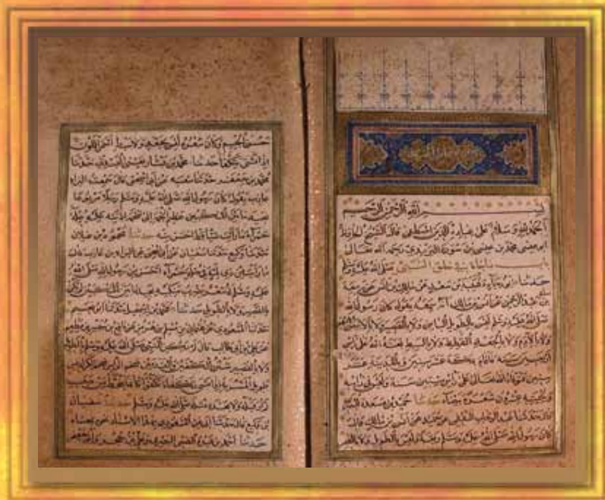
1st page of the book "al-Shamail al-Nbawiyah wa al-Khasail al-Mustafiyyah" By: Mohammed bin Eisa al-Tirmizi, D. 279 AH, Scriber in: Jumada al-Thaniya 987 AH.

الورقة الأولى من كتاب "الشمائل النبوية والخصائل المصطفوية"، تأليف الترمذي: محمد بن عيسى بن سورة السلمي البوغي، أبو عيسى ٢٧٩هـ، نسخ في شهر جمادى الثانية سنة ٩٨٧هـ.