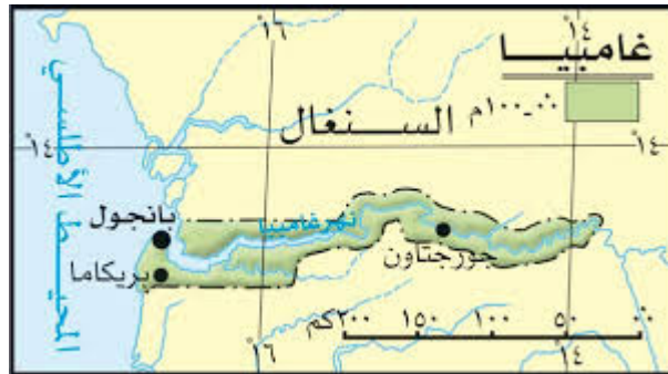
خريطة غامبيا تبين موقعها

٦. باسيه: تبعد عن سيريكندا حوالي ٣٥٠ كم شرقاً، وهي تشكل عاصمة الإقليم الشرقي