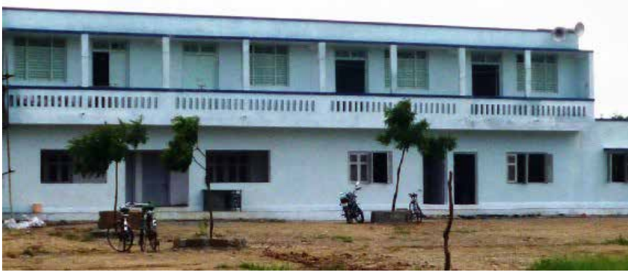
صورة المبنى الرئيس لمدرسة الجامعة الإسلامية لكاشف العلوم