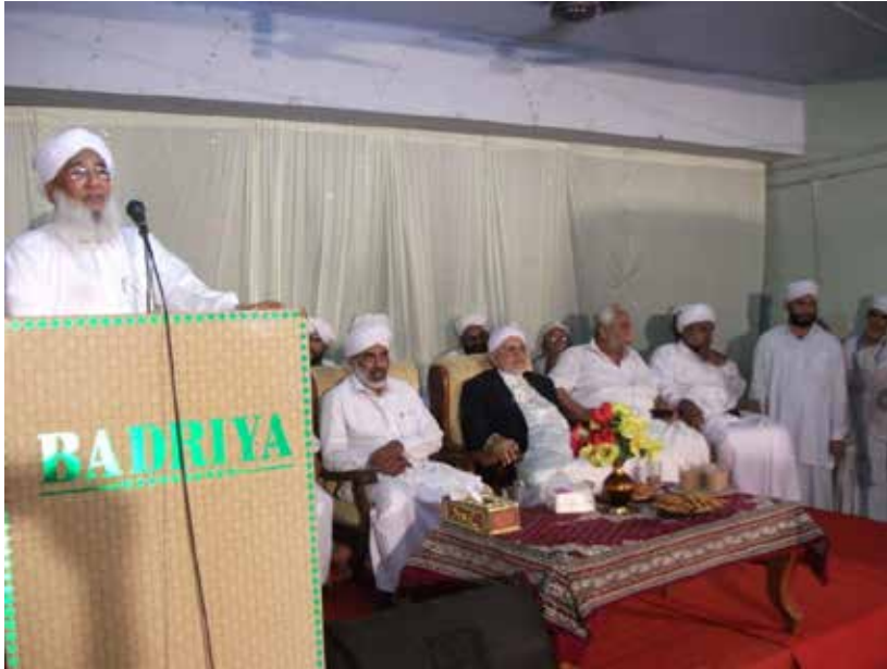
صورة ورشة تدريبية منعقدة في كلية جامعة بدرية العربية الإسلامية