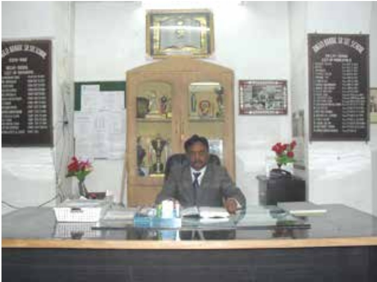
صورة داخل مكتب المدرسة