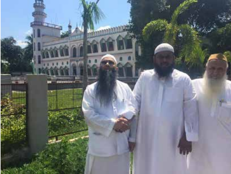
صورة المبنى الرئيس للمدرسة مع مؤسّسيها