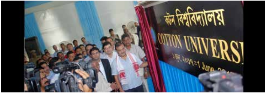
صورة افتتاح جامعة كوتون