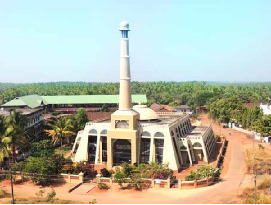
صورة المكتبة المركزية لكلية روضة العلوم العربية