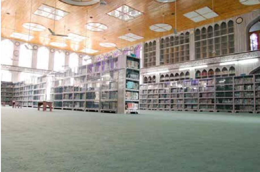
صورة داخل مكتبة دار العلوم جامعة مظهر السعادة