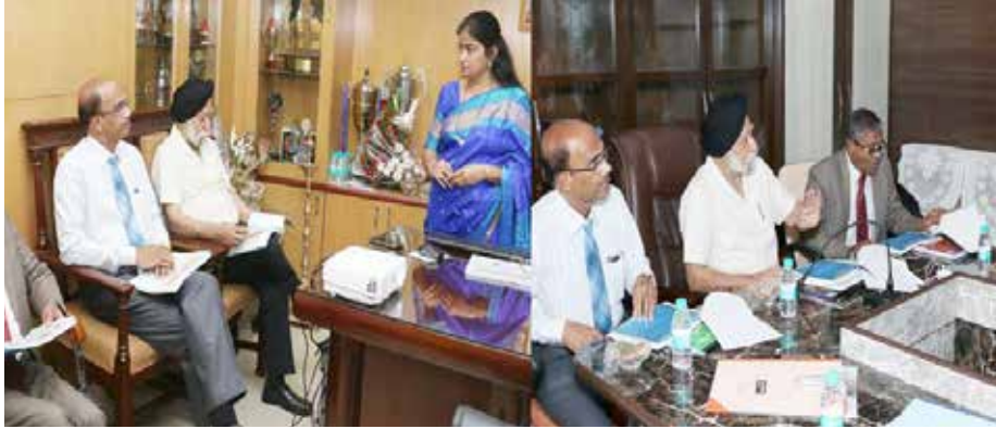
صورة مكتب عميد كلية إسماعيل يوسف