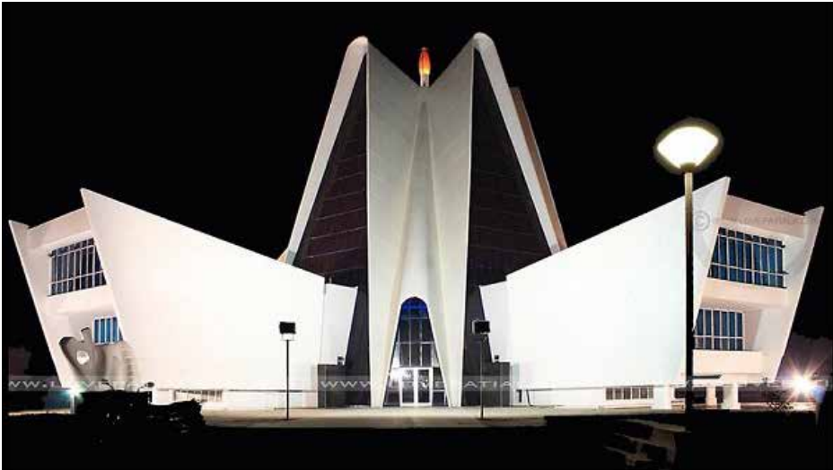
صورة المبنى الرئيس لجامعة بنجاب