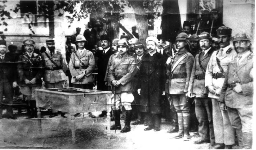
حفلة قسم تخريج الضباط في المدرسة الحربية التنكزية