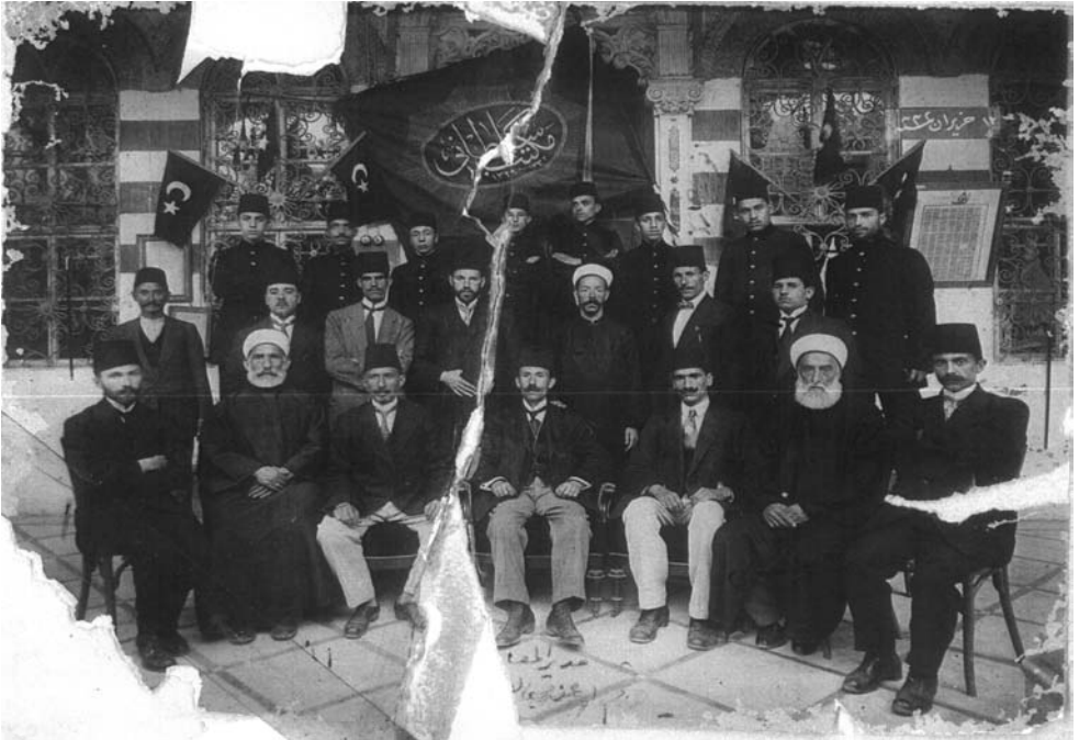
في مكتب عنبر مع الأساتذة في العهد العثماني (١٢ حزيران ١٣٣٢هـ / ١٩١٤م)