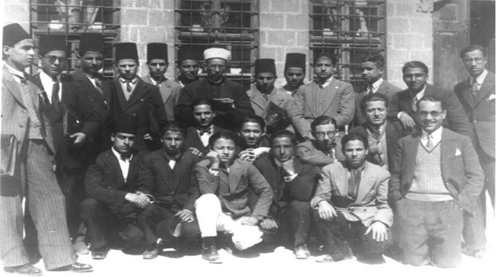
مع طلابه في مكتب عنبر سنة (١٩٣٣م)