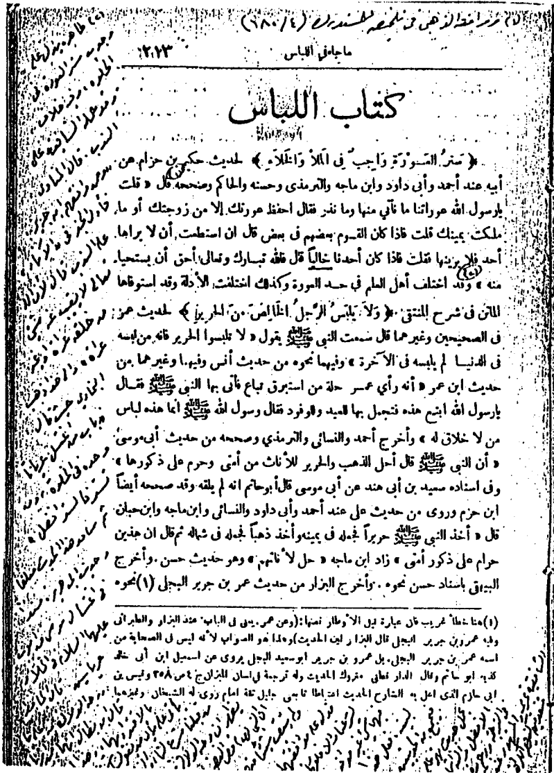
صورة نموذج من تعليقات شيخنا الألباني على الجزء الثاني من «الروضة الندية»