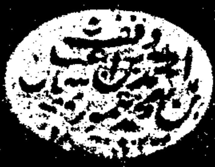
لوحة العنوان من نسخة « د »

كتاب الايمان والتبيان في معرفة المكيا والليزان تأليف الشيخ الامام ابو العباس نجم الدين احمد بن محمد ابن علي بن الرفعة الثاني