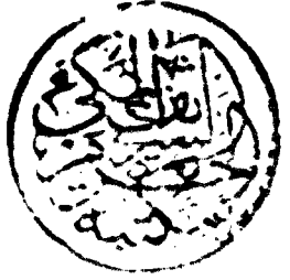
صورة اللوحة الاخيرة من النسخة المرموز اليها بحرف (م)

ما ردنا ايرادة من نقول علماء المذاهب الاربعة رضوا عنهم في هذه المسئلة وللهند وحد وصل الله وسلم على من لا نبى بعده محمد وعلى اله وصحبه وسلم وحدته عز العزير