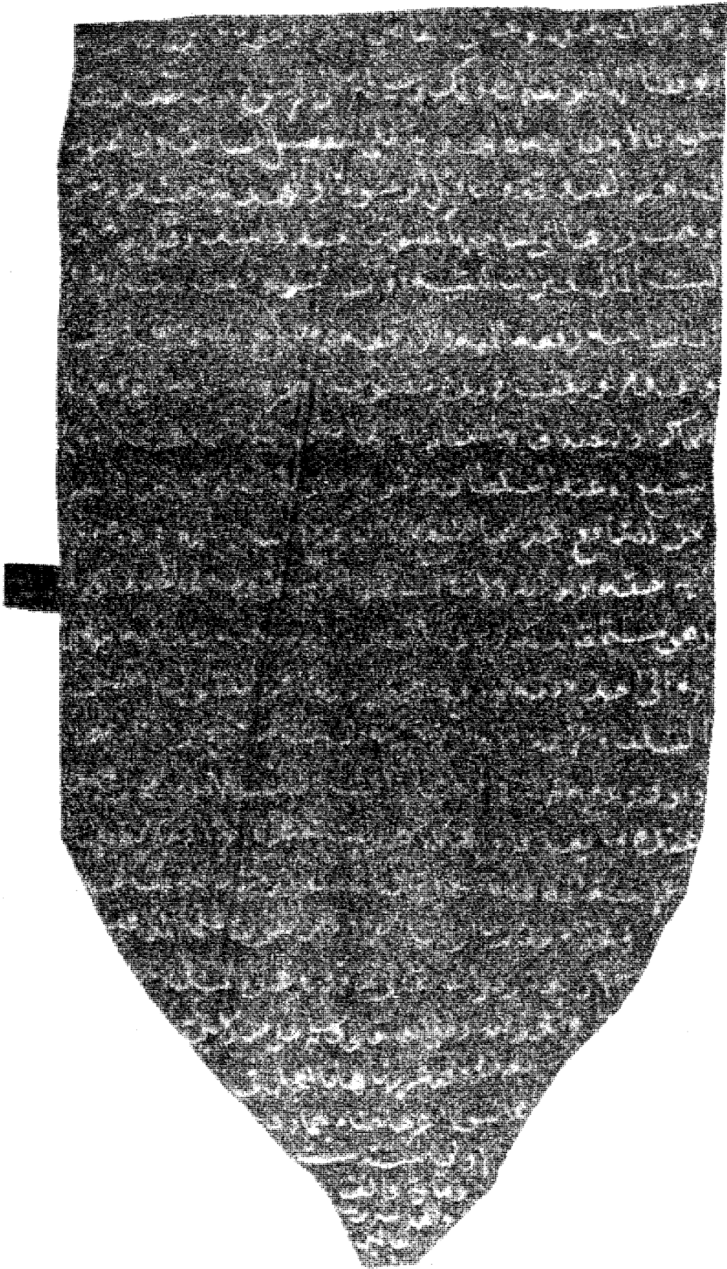
صورة آلة قنطرة الأثريه من المتحف القبطي بالقاهرة ( ٢٠ )