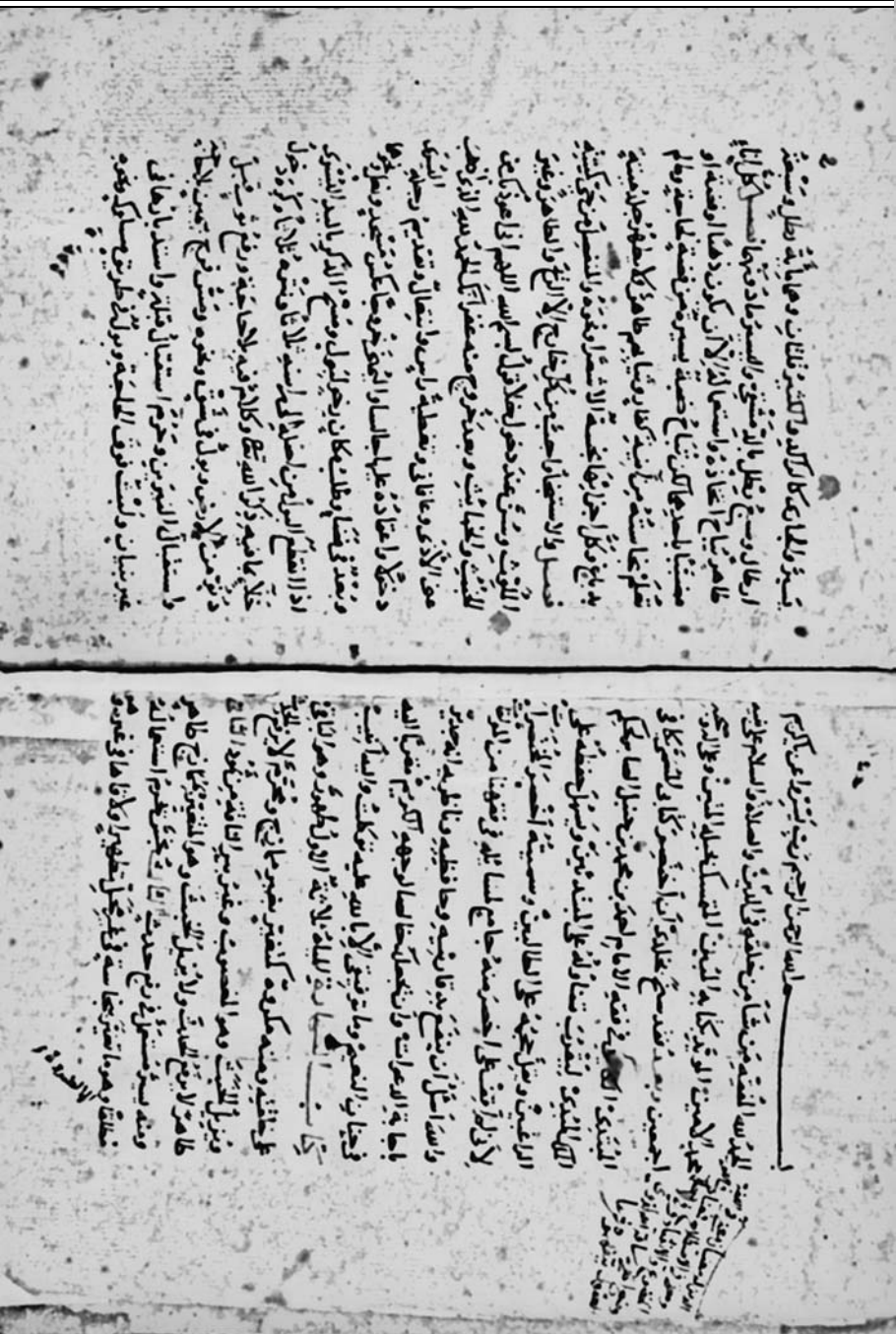
صورة الورقة الأولى من النسخة (د)