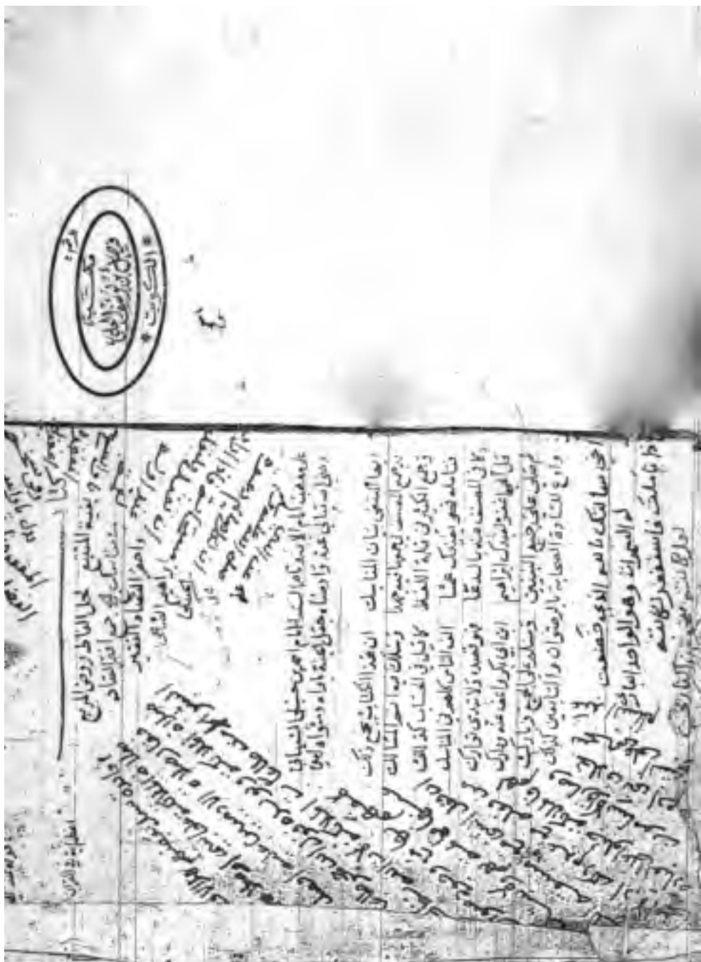
صورة غلاف نسخة مكتبة البلدية