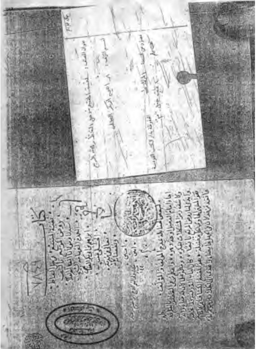
صورة غلاف نسخة دار الكتب المصرية