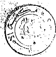
صورة غلاف نسخة (أ)