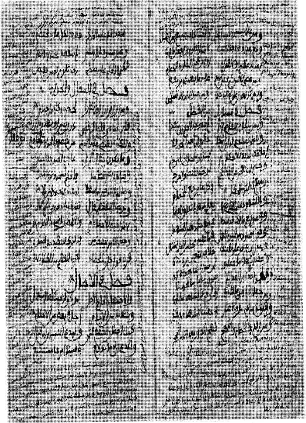
صورة الصفحة الثانية