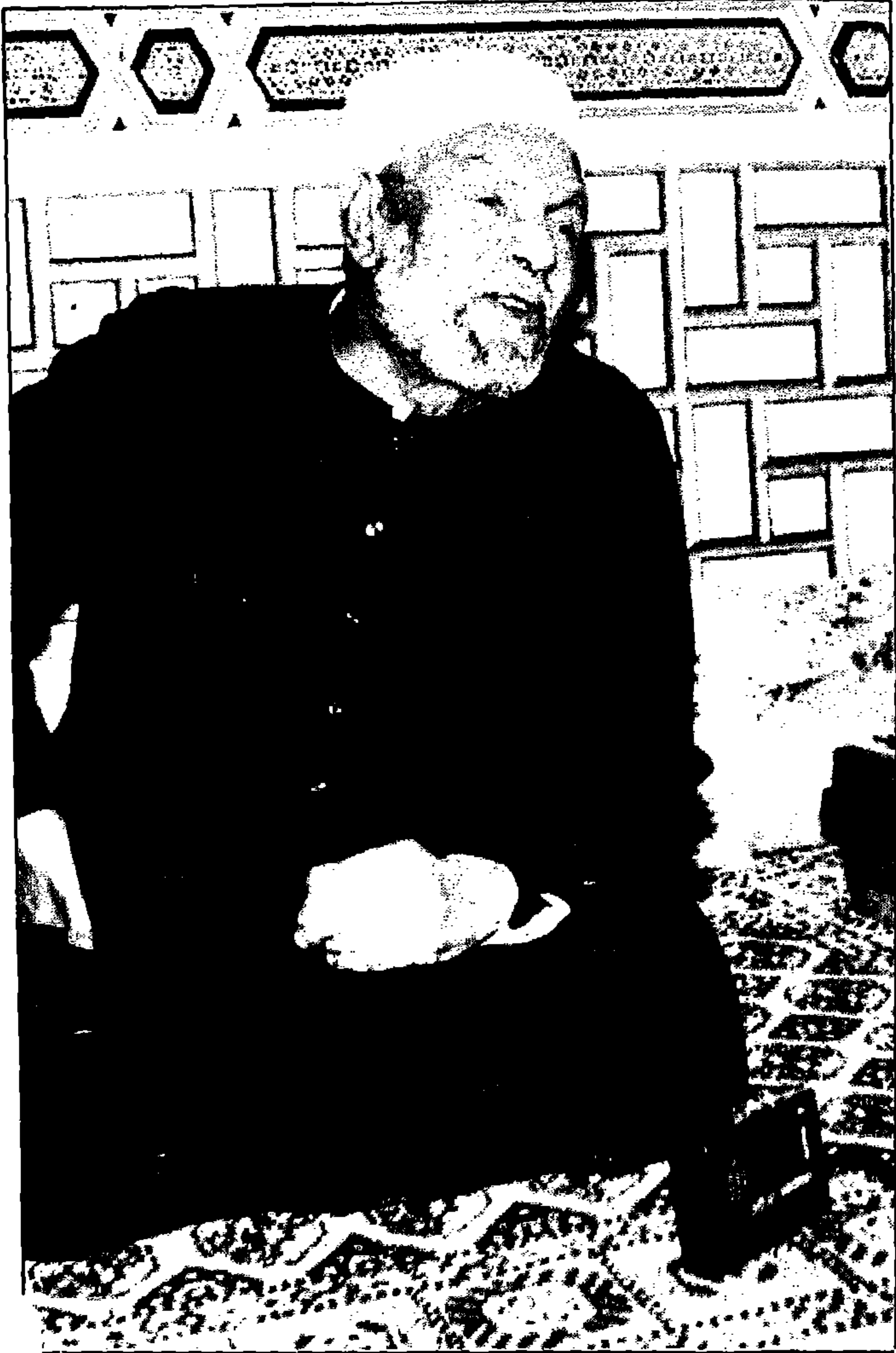
هو ساعة ما تقوم الساعة .. حد حيبقى له كلام