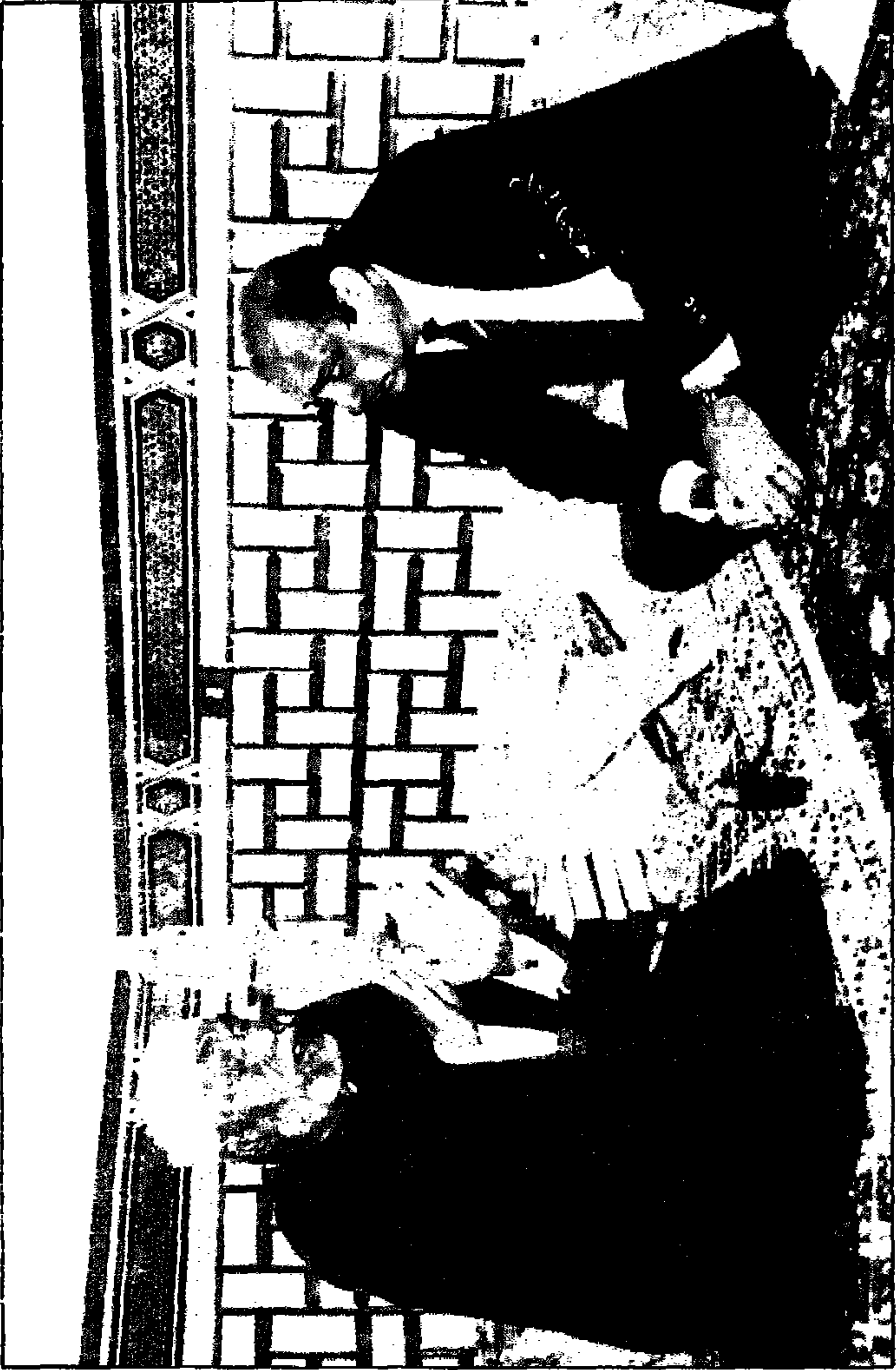
الشيخ الشعراوي يقول للكاتب محمود فوزي الحل لك السحر هو قراءة سورة الإخلاص والمعونتين!