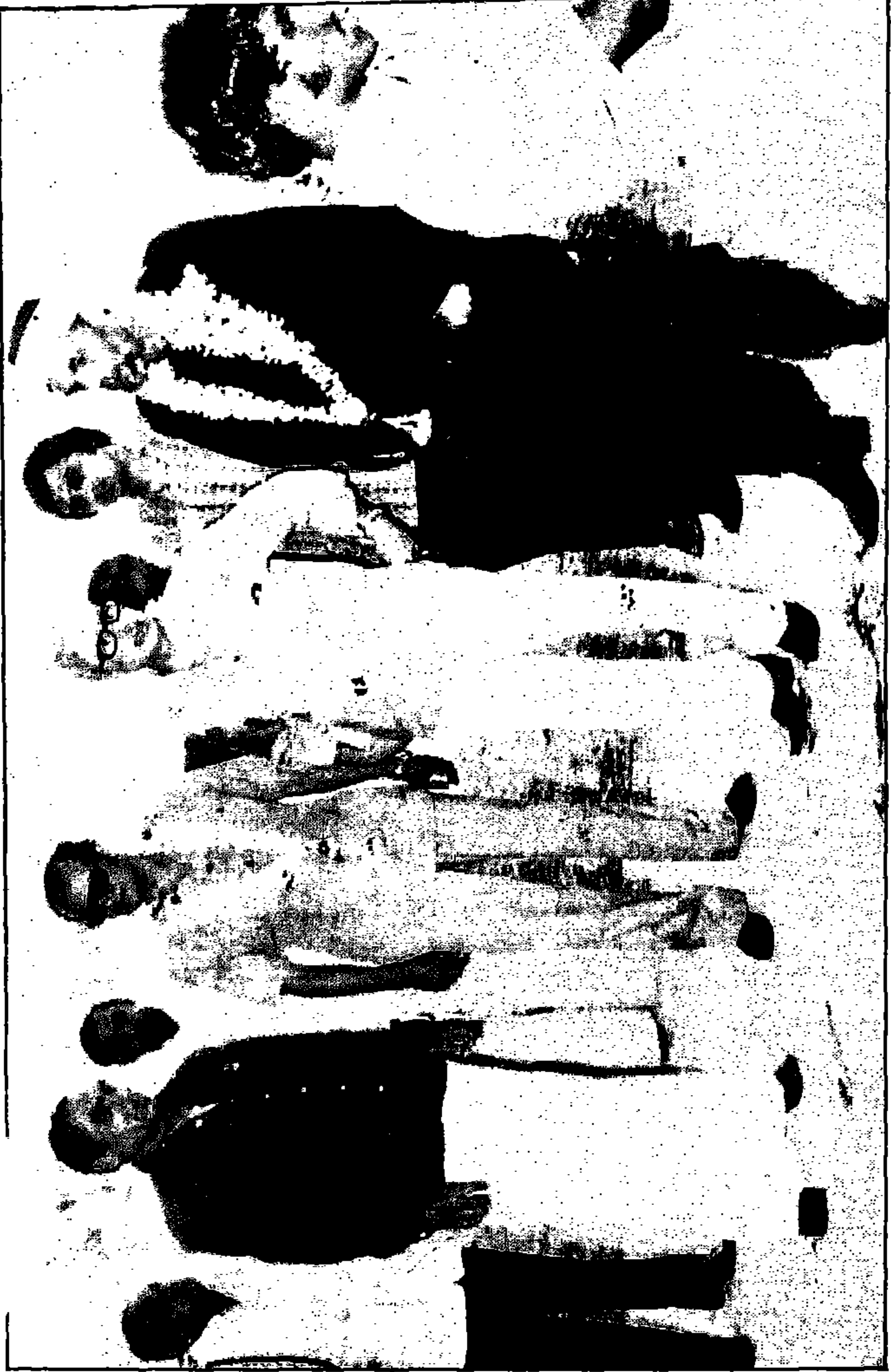
الشيخ الشعراوي أثناء تكريمه في الهند