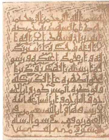
لوحه (c) الوقف القارئ المؤرخ لسنة ٢٥٠٠ هـ مصره متحف لينن بدمشق بالقاهرة