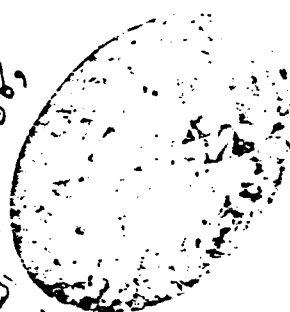
صورة العنوان للمخطوطة

قلت الف هذه الأربعين كما تراها جود القول السطحي وقصيفه على الأثر في الأوقاف كما أثاره الذكر في نسخة من أول شهر رجب وكان تأليفه في سنة سنة ١٥١٥ سنة ١٥١٥ سنة ١٥١٥ سنة ١٥١٥