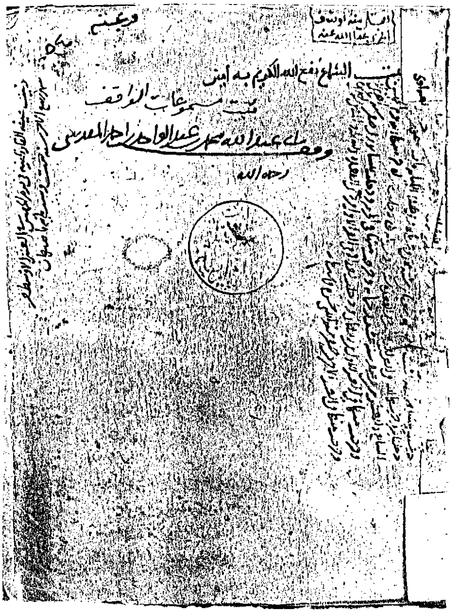
صورة صفحة العنوان من الثبت (القسم الأول)