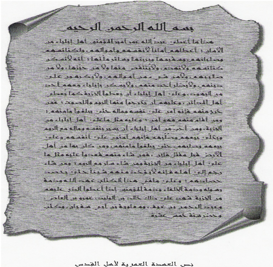
نص العهدة العمريّة لأهل القدس