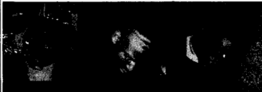
Raymond Santana, 14

Last week in Manhattan these six teenagers were indicted for the rape of a 28-year-old investment banker who was jogging in Central Park. Two other youths were indicted for assaulting a male jogger on the same night.