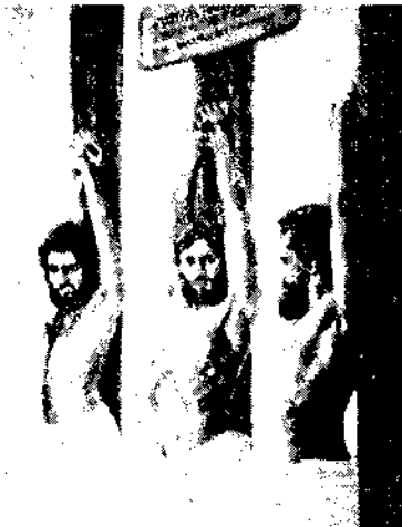
THE WATCHTOWER — OCTOBER 15, 1983 5