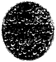
الورقة الأخيرة من نسخة مكتبة عارف حكمت

وباهل النار خلود ولا موت فهذا آخر احوال هذه النطفة التي هي مبتدلاتان وما بين هذه المبراة وهذه الغائبة احوال وطبقات قود العرش العظيم تنقل الانسان فيها ويكويها لها طبقا بموافق حتى يصل لها ما يشتم من العلة والشقاوة قتل الا بالما كلف مما يشتم خلقه من نطفة خلقه فقوته ثم السيل يتوه ثم مات فاقبوه ثم اذا شاء انشره كذا ما يقض امره فساله العظيم ان يجعلنا من الذين سبقت لهم جنات الجن ولا يجعلنا من الذين غلبت عليهم الشقاوة في الدارين والآخر انه سمع الدعاء وهو حسبان ونعم الوكيل والارادة رب العالمين وصلى الله على سيدنا محمد وآله وصحبه وسلم تليها كبرياء اليوم الدين تم بمؤامنه ويطعم ٦٤