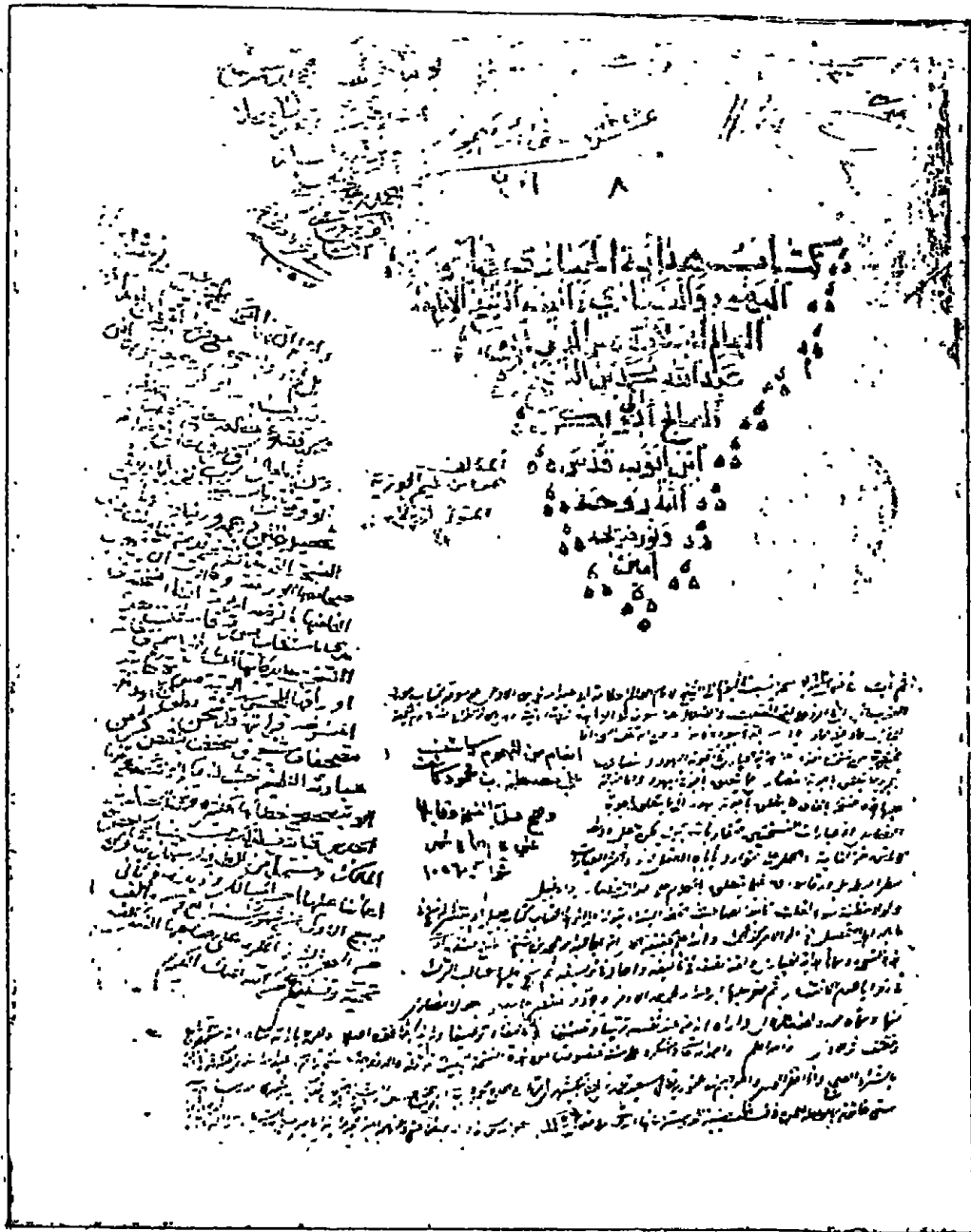
الصفحة الأولى حجم الثلثين من المخطوطة رقم ٣٠١ رمز (٢) التي طبع الكتاب عليها مقارنا بالنسخة لثر المخطوطة رقم ٢١٣٦٩ رمز (ب) في دار الكتب المصرية.