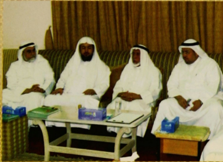
حفل العشاء في المنبرة بعد جلسة السماع مباشرة على شرف معالي الوزير والضيف والوكيل