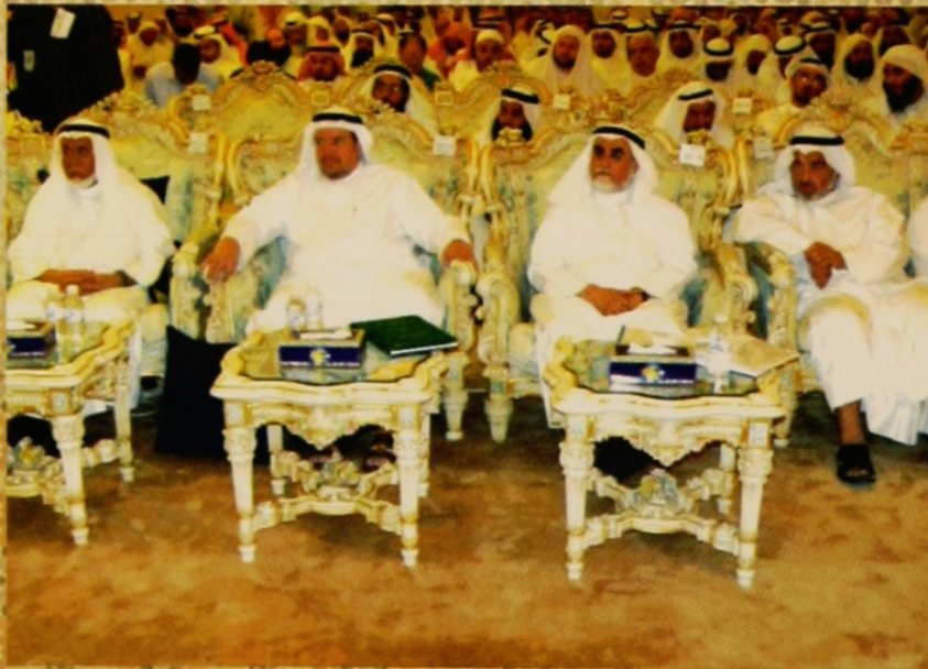
من اليسار معالي الوزير وسعادة الوكيل ورئيس الخبرة ومدير إدارة المسجد الكبير يشاركون في مجلس السماع