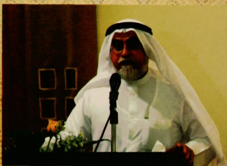
كلمة رئيس المبرة بعد مجلس السماع