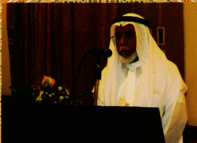
كلمة معالي الوزير بعد مجلس السماع