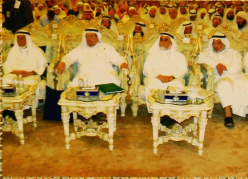
من اليمين معالي الوزير ورئيس المبرة ومدير إدارة المسجد الكبير ومدير مكتب الوزير في إصغاء لمجلس السماع