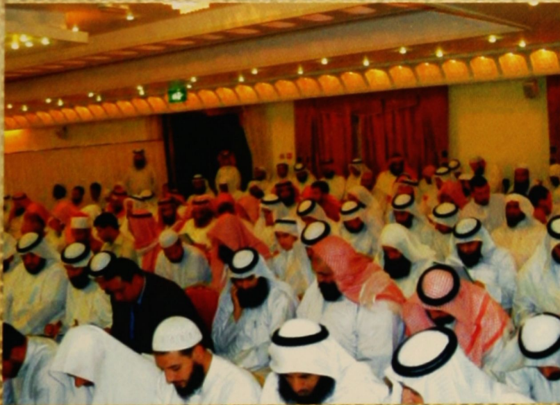
الإنصات والمتابعة من جمهور السماع