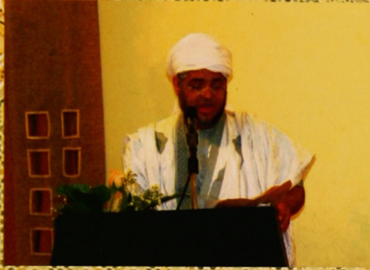
الشاعر الموريتاني محمد خال أبو الشنقيطي يشارك بقصيدة شكر للمخبرة والوزارة