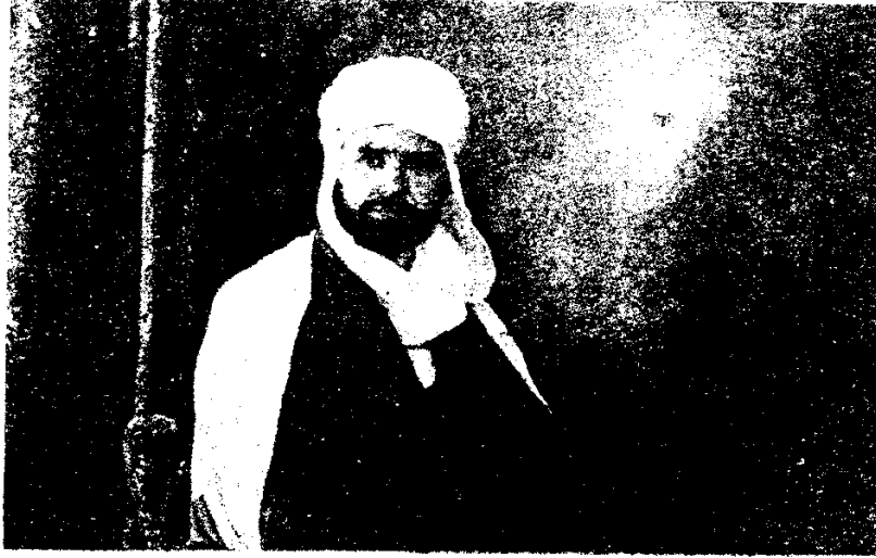
الشيخ مبارك الميلي

الوجود ، يريدون ان يخفتوا كل صوت يعارضهم ، ويتغلبوا - بجرائمهم الوحشية - على من لم يجذب سيرتهم ويسلك طريقهم ، يريدون ان يسكنوا من اباحت لهم الدولة الكلام ويهتكوا لبلوغ ارادتهم - حجاب الامن العام .