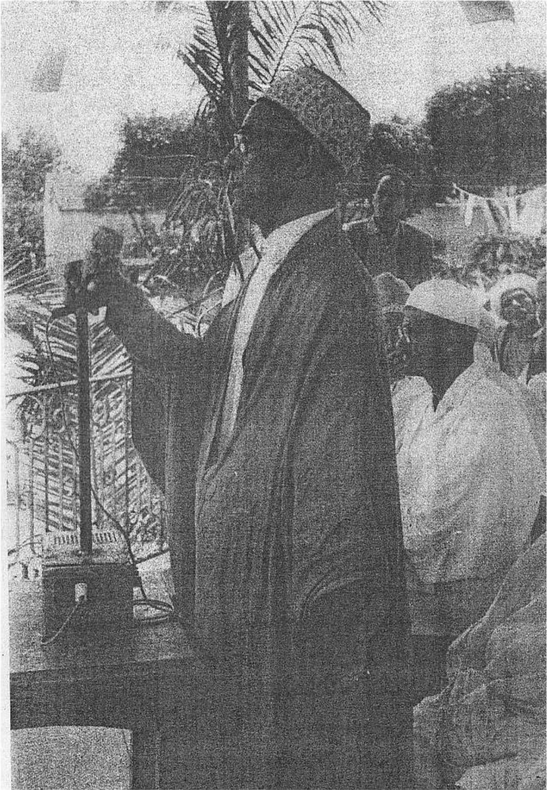
الشيخ محمد الصالح بن عتيق