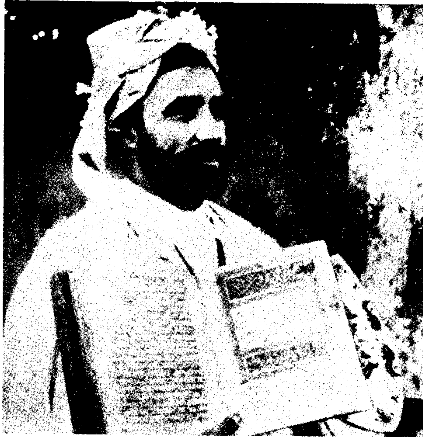
الشيخ الطيب العقبي