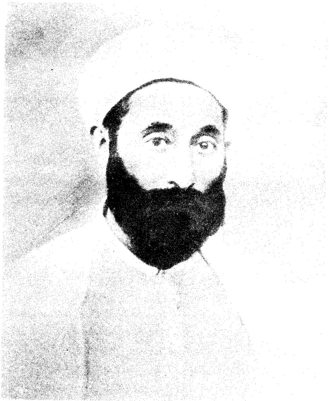
الإمام المصلح الشيخ عبد الحميد بن باديس