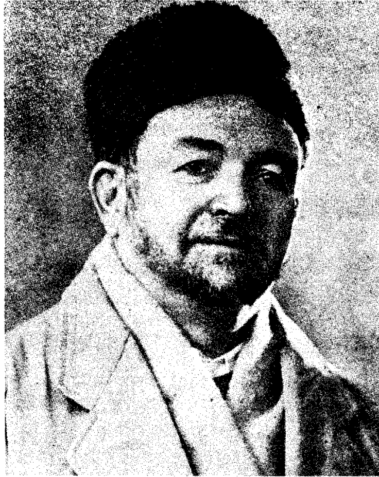
الشيخ العربي بن بلقاسم التبسي