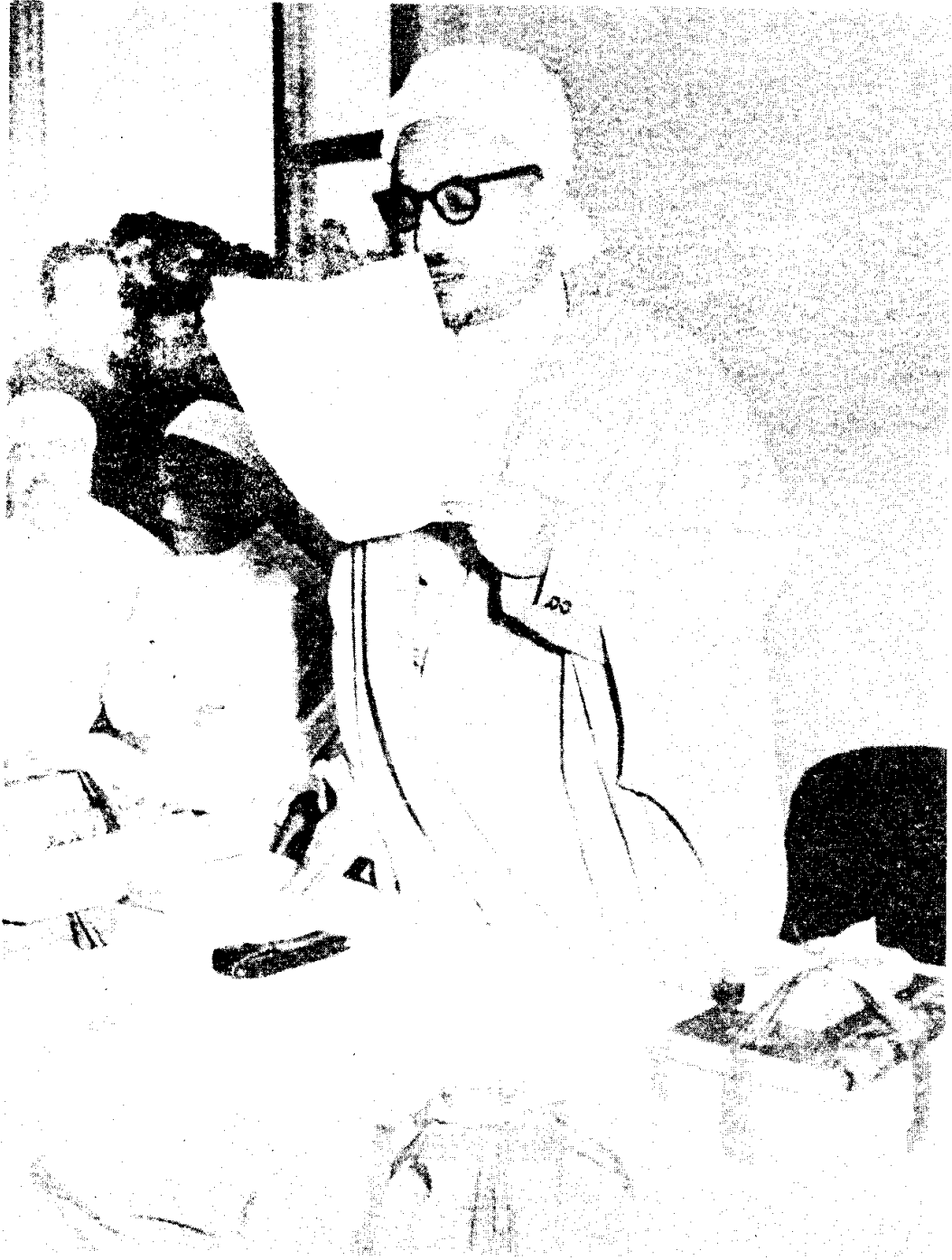
الشيخ محمد خير الدين