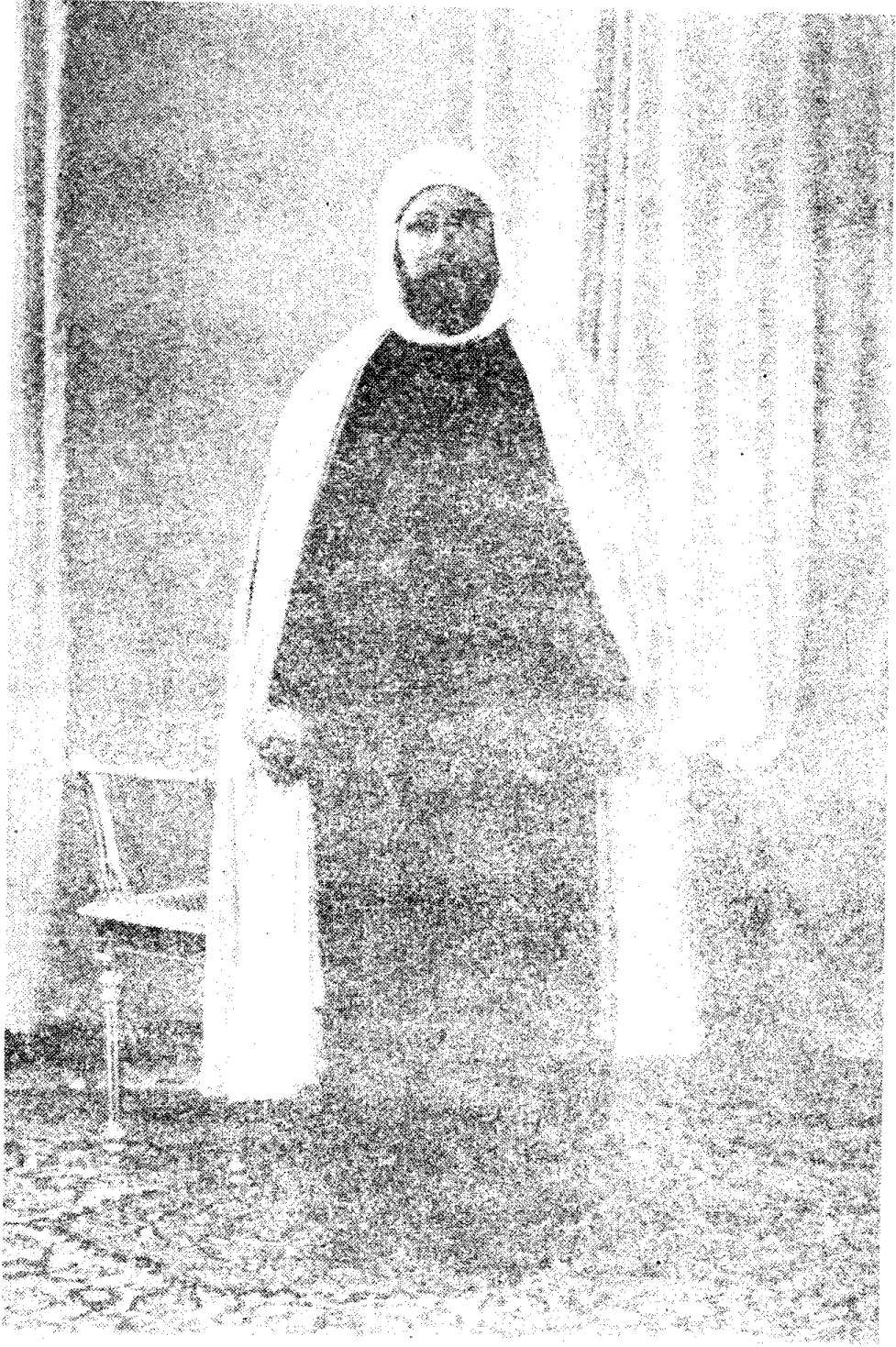
الشيخ محمد العيد آل خليفة