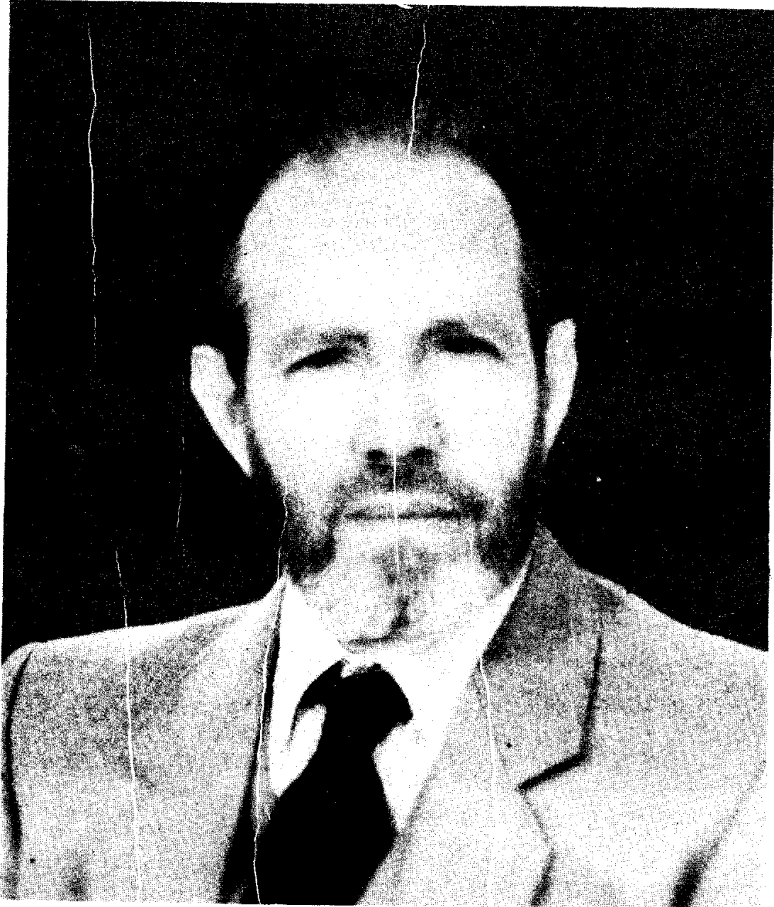
الشيخ أحمد حماني