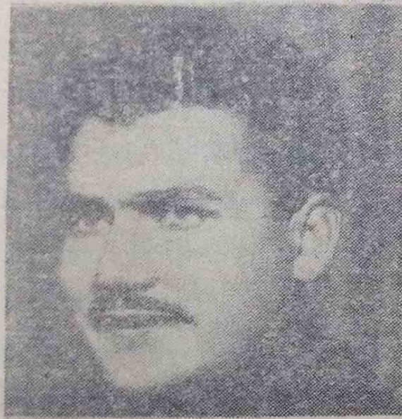
صورة مؤلف الكتاب