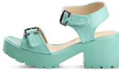
ترافيل، 170 د.إ.ر.س