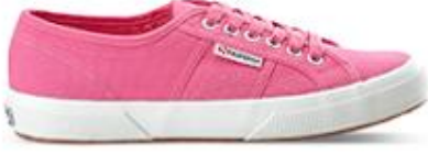
سوبرجا، 245 د.إ.ر.س