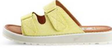
دون تو ارت، 200 د.إ.ر.س