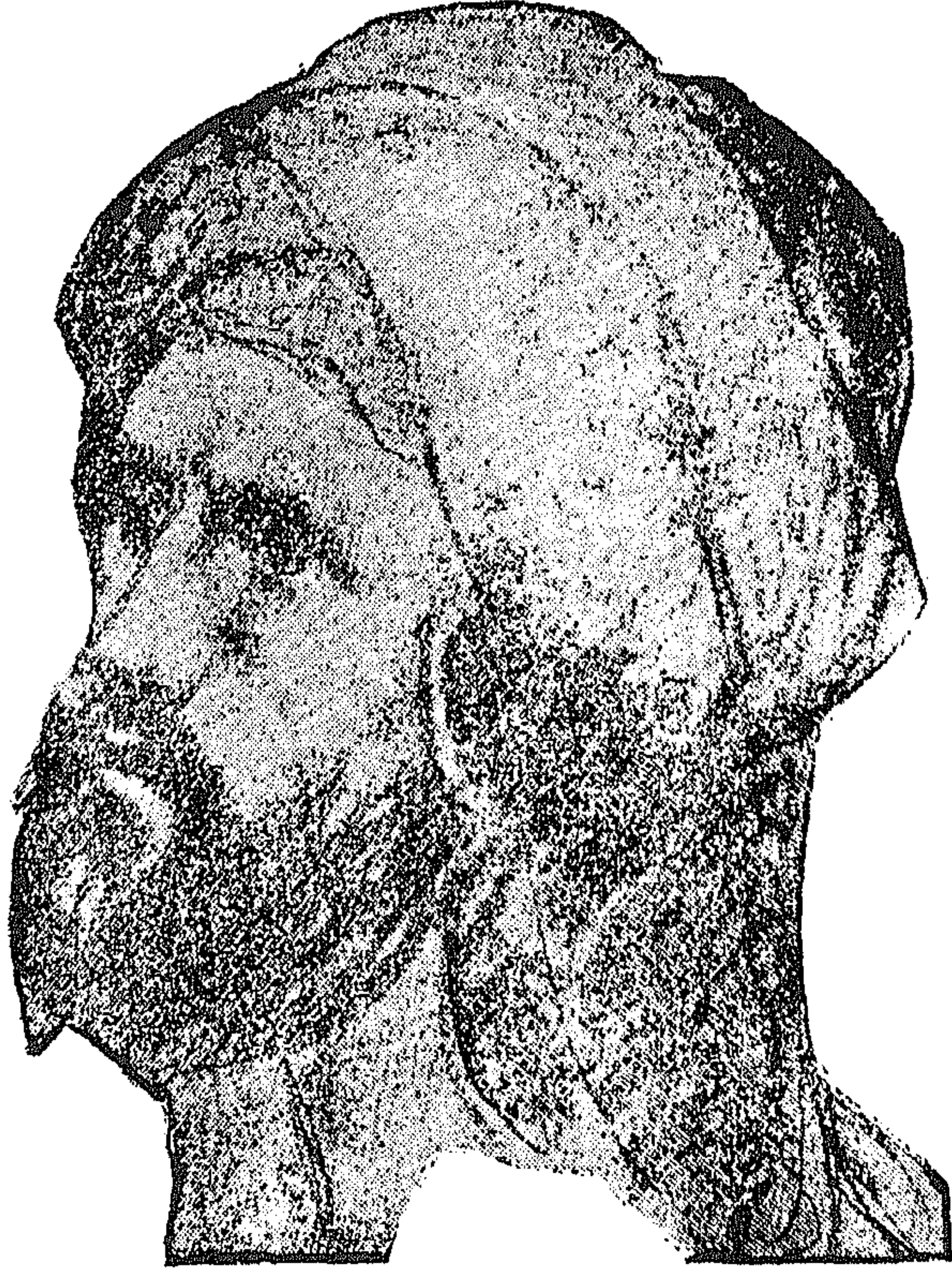
ديك الجن الحمصي