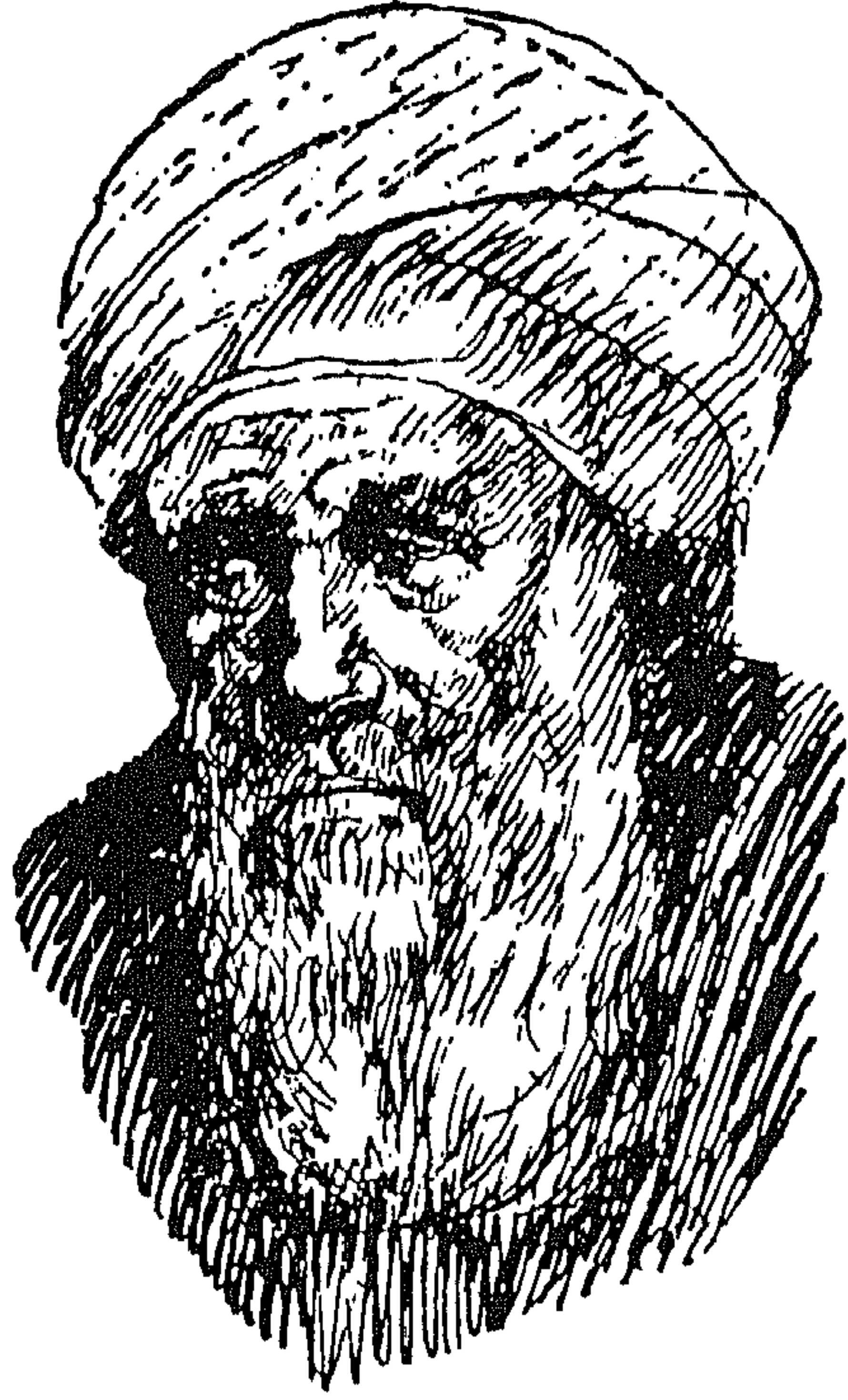
أبو العلاء المعري