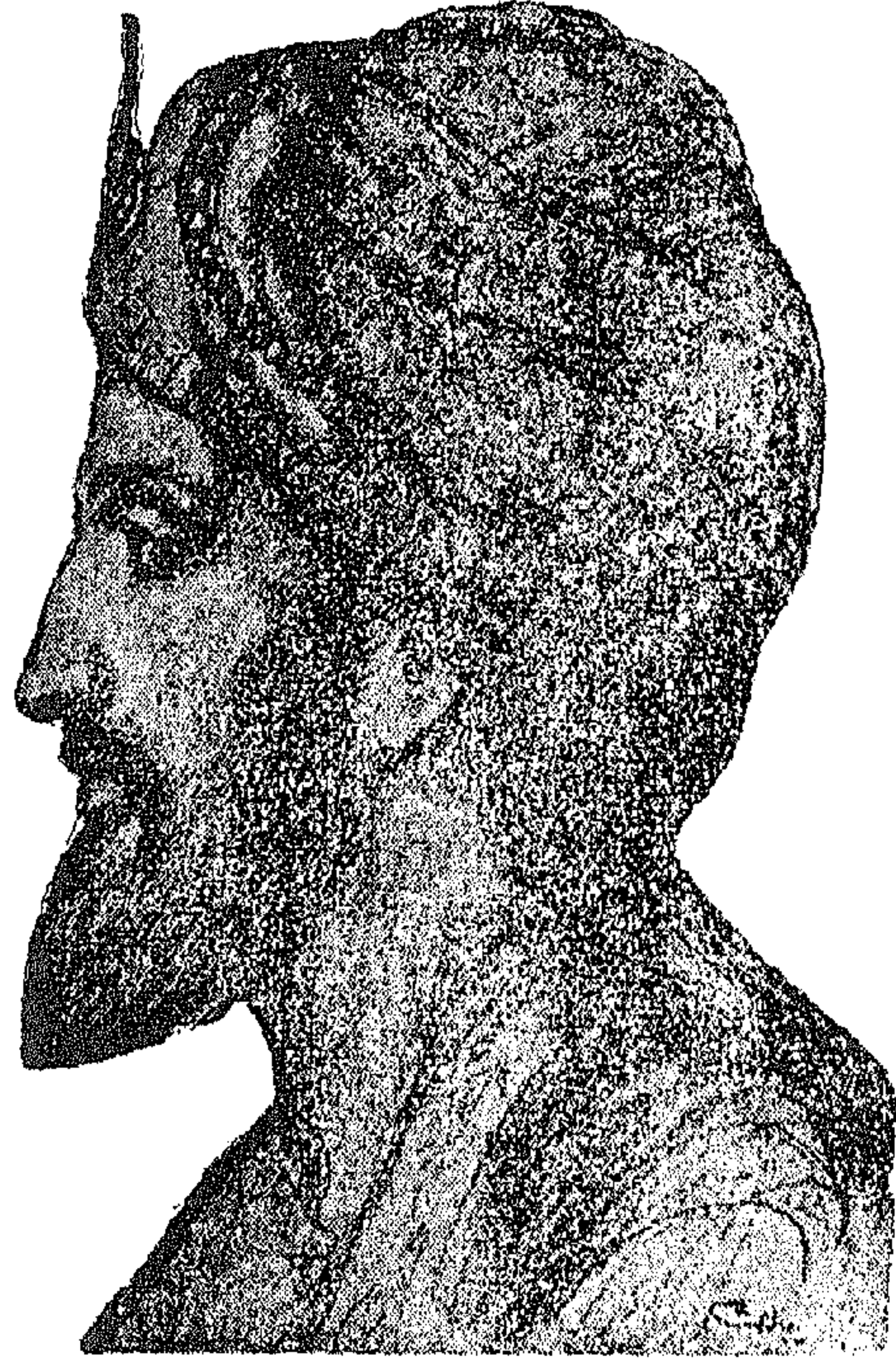
المعتمد بن عباد