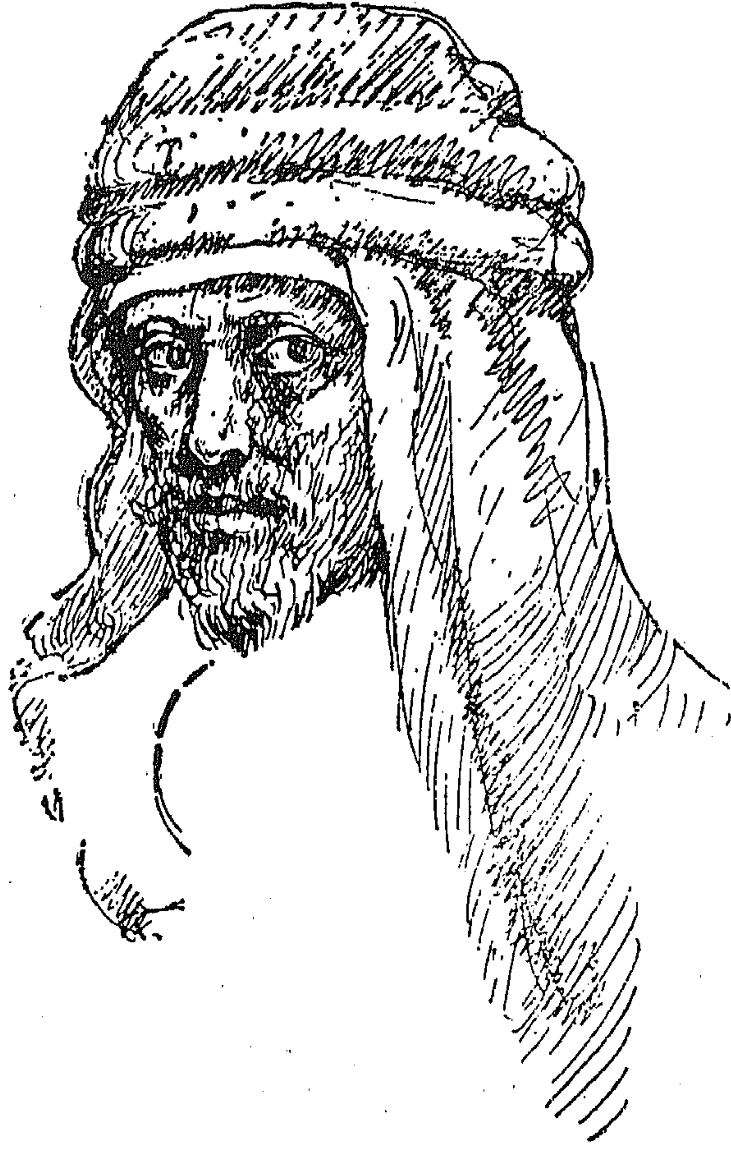
أبو الطيب المتنبي