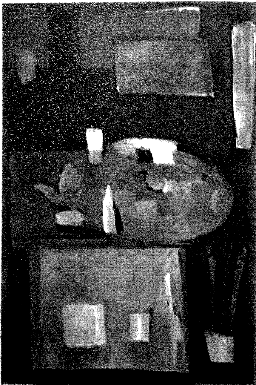
Nicolas de Staël : Coin d'Atelier. 1954.