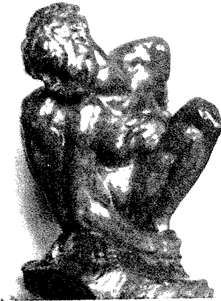
Rodin : Photo Adelys.