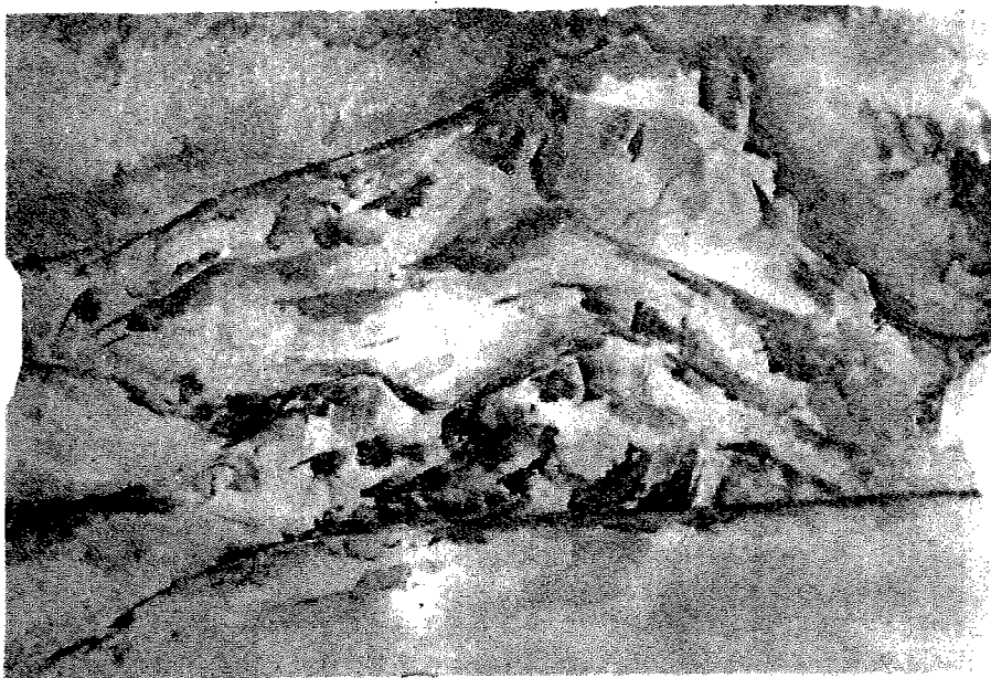
Cézanne : La Montagne Sainte-Victoire. Aquarelle.