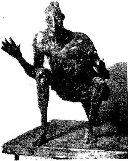
Germaine Richier : « La sauterelle » bronze 1946-57.