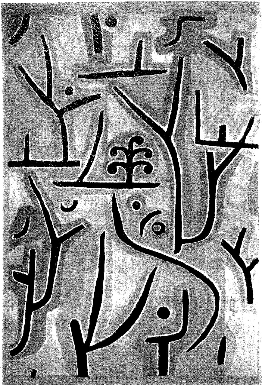
Paul Klee : Park bei Luzern. (Cosmopress, Genève).