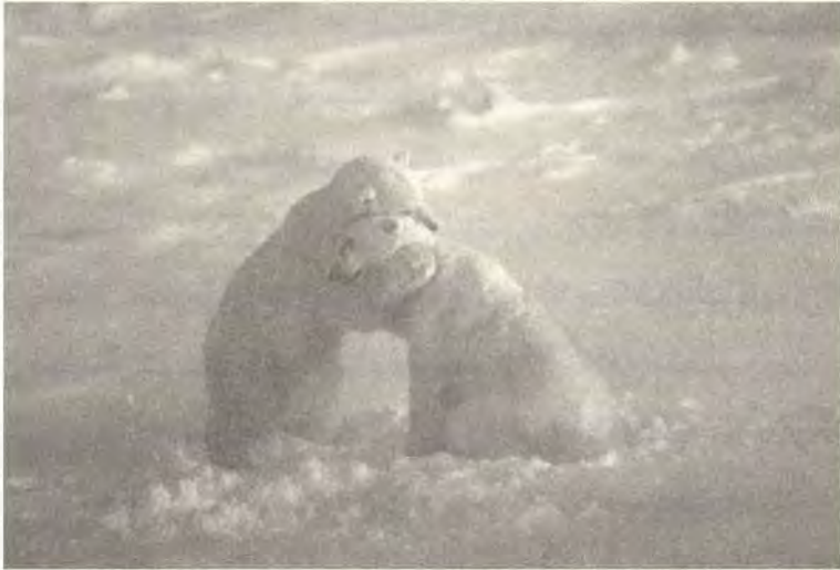
لقطة تجمع بين ديبين قطبيين في لحظة تعاطف في خليج هدسون، مانبتوتا، كندا.

الذي يهرول على طول السور باتجاه حاوية طعام الطيور. لكن الحياة بالنسبة للحيوانات، كما الحال بالنسبة للبشر بالضبط، لا تستقيم دون العلاقات الاجتماعية. وكما يوحى البرنامج الشهير «ميركات مانور» (Meerkat Manor) الذي يذاع على قناة Animal Planet، فإن حياة الحيوانات تشبه المسلسلات العائلية مثلما هي حياة البشر. فالحيوانات تكوّن صداقات، وتكذب وينكشف كذبها، وتضبط وهي تسرق ومن ثم تفقد هيبتها في مجتمعتها، وتتوّدّد للجنس الآخر، وتوحي بإيحاءات جنسية يقبل بعضها ويرفض لبعضها الآخر، وتتشاجر، وتتصالح، وتعشق، وتعاني من فقدان. وبينهم الصالح والطالح كذلك.