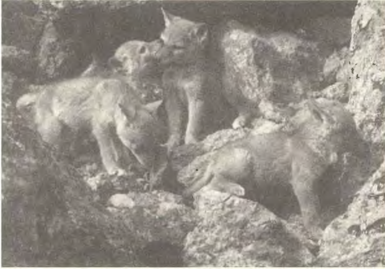
صغار ذئاب البراري تلعب خارج وكرها في عمية يلوستون الوطنية بولاية وايومنغ.