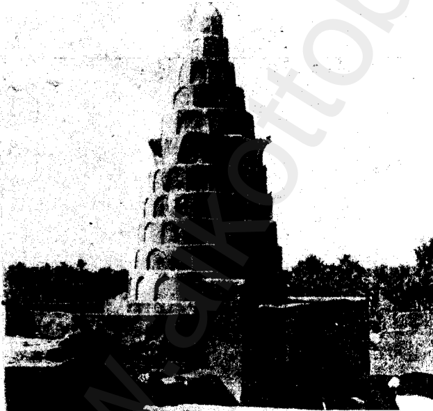
التصوير رقم ٢ مرقد حزقيال في الكفل

ووصف هذا القبر لوفتس (Loftus) في سنة ١٨٥٣ قال: «يقوم المزار من دارين معقودتي السقف. فسقف الدار الخارجية يستند إلى أعمدة ضخمة، أما المزار فهو صندوق كبير وقديم الأيام طوله عشر أقدام وارتفاعه أربع أقدام ومزين بشيت إنكليزي وبعض أعلام حمراء وخضراء ويزين السقف المعقود أدراج ذهب وفضة وفلذ وقد بني في إحدى زواياه أسفار موسى الخمسة بالعبرية ويظن أن حزقيال النبي كتبها بيده. وهناك قنديل موقد ليلاً ونهاراً ويقال إن حزقيال بنفسه أوقد ذلك القنديل وبقي على تلك الحال منذ ذلك العهد ويغرون الزيت والفتائل كلما دعت الحاجة إليه» (غنيمة ص ١٩٩ - ٢٠٠).