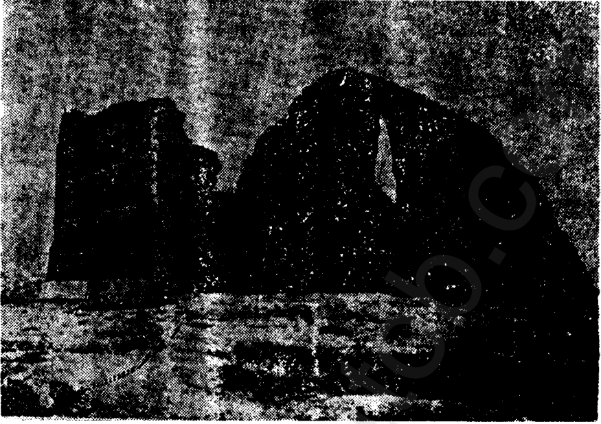
«طاق كسرى أحد قصور الساسانيين ولعل مشيده شابور الأول