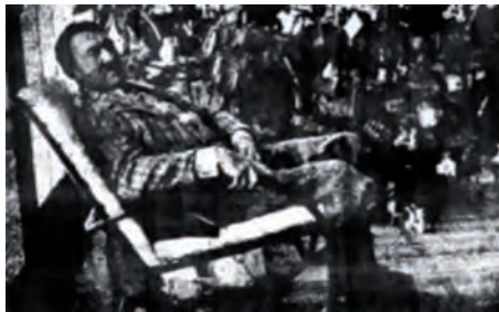
هتلر في حياته الهادئة.