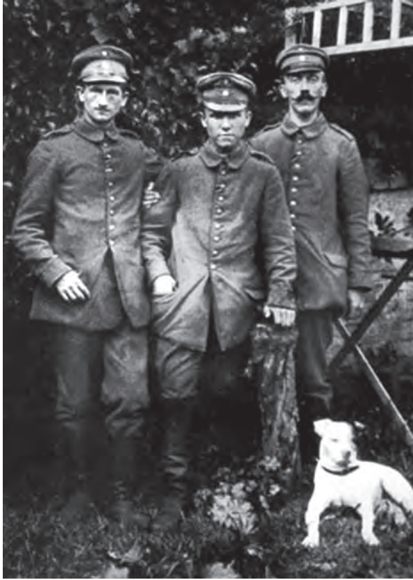
هتلر مع زميلين.

وقد وقع الاختيار على هتلر للمراسلة في مكتب الفرقة المتطوعة فلم يكن من الذين يحضرون حرب الخنادق في جميع الملاحم. وثبت أن الإصابة التي انتقل من جِرائها إلى المستشفى قبيل انتهاء الحرب كانت أهون كثيراً من الأخطار التي تعرض لها غيره؛ لأنها كانت إصابة بالغازات المُدْمعة Lachrymatory gas. التي لا تستلزم الالتحام في الهجوم، ولو أنه أصيب بأقوى من هذه الغازات لما سلم نظره ولا زالت آثاره كل الزوال كما ثبت من امتحان عينيه.