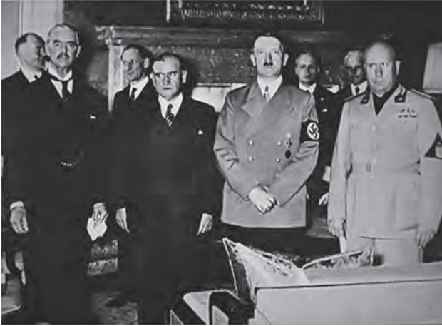
هتلر مع شامبرلين ودلاييه وموسوليني.

قال لهم البسوا الكساوى والشارات التي تحبونها، واخرجوا في الشوارع صفوفًا صفوفًا تزعمون وتتوعدون، واضربوا اليهود واضربوا الشيوعيين واضربوا الديمقراطيين واضربوا النازيين المخالفين ... اضربوا اضربوا ولكم المجد والفخار وعلى فرائسكم المسببة والعار.