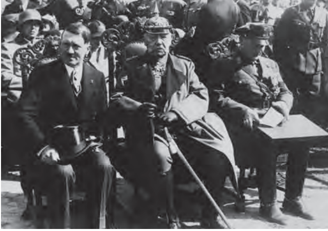
الماريشال هندنبرج بين هتلر وجورنج.

إلا أن الحوادث قد خالفت ما قصد من تدبيره، فجرت الانتخابات الجديدة بإشراف المستشار هتلر على الطريقة النازية المعهودة، وصدرت المراسيم بحل جماعات الشيوعيين، واشتد المرض بالماريشال الهرم فأصبح لا يعي ما يقول ولا ما يقال بلسانه، ثم مات وتبوأ هتلر مكانه باسم زعيم الأمة ومستشار الدولة، وأفلتت الأعنة من يدي فون باين فانقاد لسائقه.