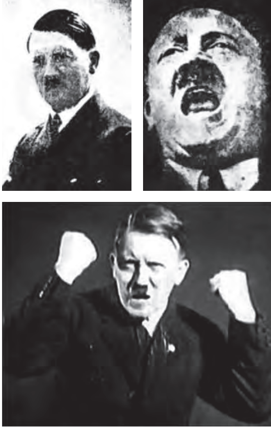
هتلر بين الوجوم والغضب الخطابي.

فالرجل المفطور على عاطفة يساجل بها العواطف، وفكرة يقابل بها الأفكار، يقول ويسمع، ويستميل الفرد بالوسائل التي يستمال بها الأفراد، مرةً بالإيحاء ومرةً بالدليل ومرةً بالشرح المفهوم، وفي كل مرة بتبادل الثقة والاعتراف بحق المناقشة والاعتراض. أما الرجل الذي نضبت نفسه من جانب العاطفة الفردية، والذي ليس عنده ما يتبادل به مودة بمودة أو فهمًا بفهم أو خاطرًا بخاطر، والذي انقطعت جميع الوشائج