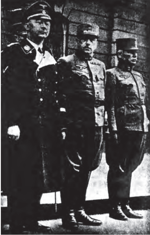
هيملر عين هتلر التي لا تغمض وإلى جانبه ضابطان نمسويان.

للأخبار واختراعًا للجنايات والأكاذيب، وقيامًا «بوظيفة نازية» لا يخطر على البال أن يضطلع بها رجل صادق شريف.