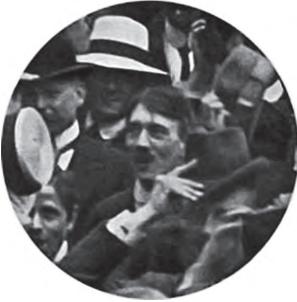
هتلر يسمع إعلان الحرب الماضية سنة (١٩١٤).

فإنكار الجريمة لا ينفى طبيعة الإجرام. وكفى أن يكون الشر سهلاً يواقعه المرء لأيسر ضرورة أو لضرورة موهومة لتثبت طبيعة الإجرام أيما ثبوت. وما ضرورة دانزيج، وما ضرورة تأجيلها أو انتظار اليأس من المفاوضات فيها؟ ليست بضرورة على الإطلاق. لكنها مع هذا كانت أعضل على هتلر من معضلة المغامرة بسلام الدنيا ومصير بني الإنسان.