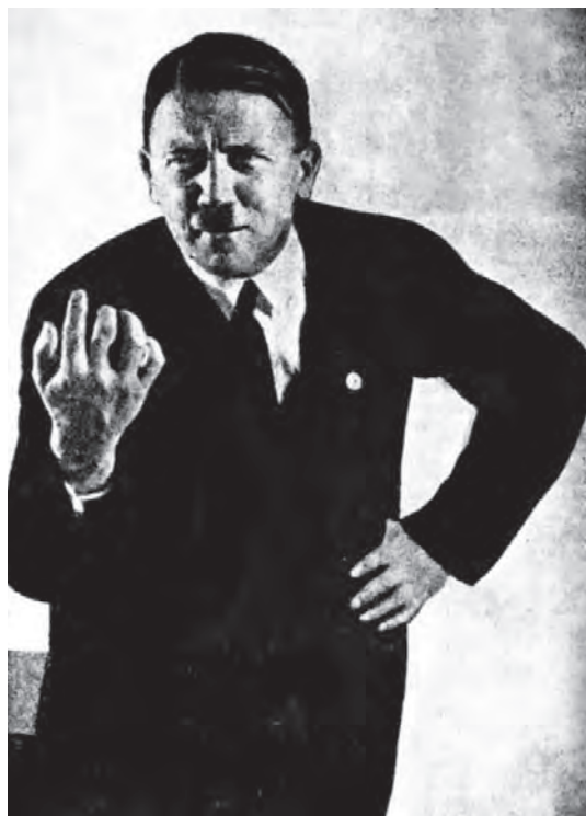
هتلر یوضح نفسه.