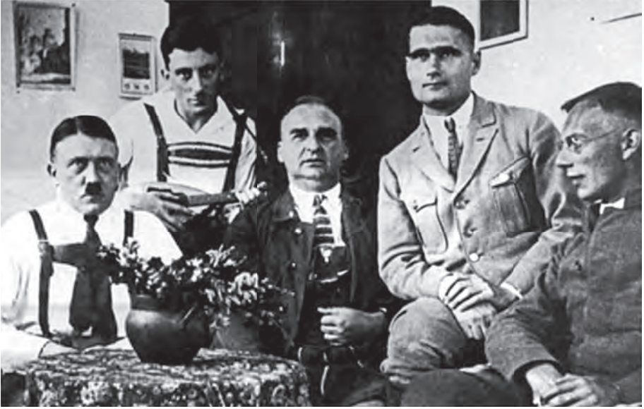
هتلر وزملاؤه في السجن (تلاحظ هدية الزهر التي كانت أمامه).

ولما تبين أن «الجنسية الألمانية» لا تشمل له لأنه رعية الحكومة النمسوية، احتالت وزارة برنسويك على الأمر بتعيينه في وظيفة «شرفية» تسمى وظيفة الاستشارة في تلك الحكومة Regierungsrat ليصبح ألماني الجنس بحكم التوظيف؛ وفقاً لدستور فيمار الذي يشمل الجنسية الألمانية كل أجنبي يشغل وظيفة في حكومات الولايات، أو حكومة الريخ الكبرى.