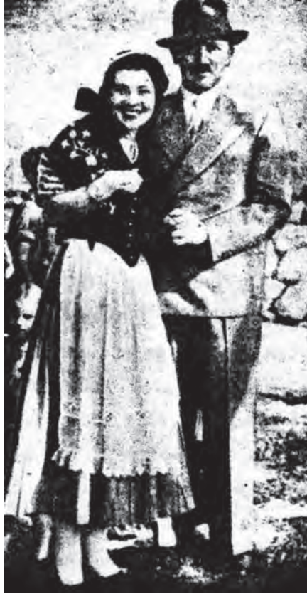
موقف هتلر مع فتاة.

وبعد أشهر قليلة قتل هتلر هذا الصديق والزميل ومئات من رجاله شر قتلة، ووصمه بكل رذيلة من الرذائل التي كان يعلمها ويعتذر عنها بين أصحابه، ولا تمنعه أن يفخر بالصدقة والزمالة للعزيز إرنست روهم. ولم يتقدم هتلر بوثيقة واحدة تُسوِّغ تلك المجزرة الجائحة فيما بين يوم وليلة، مع استيلائه على أزمّة البحث والتحقيق في البلاد الألمانية بأسرها.