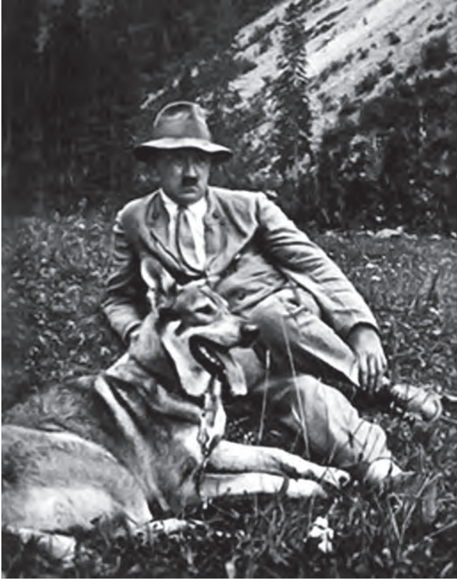
هتلر مع كلبه.

بمجهود عظيم. فلماذا غابت أدلة البر كلها ولم يبقَ لها من دليل في نفس هتلر إلا البر بذكرى أمه؟ وإلا ما يقال من مودته للطفل والكلب والعصفور وهي الخلائق التي يشتري مودتها ولا تكلفه من جانبه مودة إنسانية كبيرة؟ سبب واحد يفسر ذلك أوضح تفسير وأصدق تفسير، وهو أن المودة الإنسانية في نفسه ضعيفة، وأنه لم يكسب إلا مودة