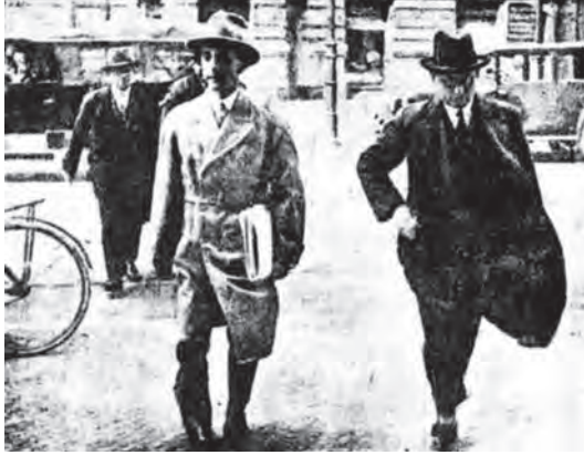
جوبلز «الآري» يحرسه رجال الشحنة.

معرّضاً به: «نحن الألمان نحب صيغة الجمع لغير داعٍ». فنقول مثلاً: إن الأكاذيب قصيرة الأرجل ... لماذا لا نختصر فنقول: إن الأكاذوبة لها رجل قصيرة!