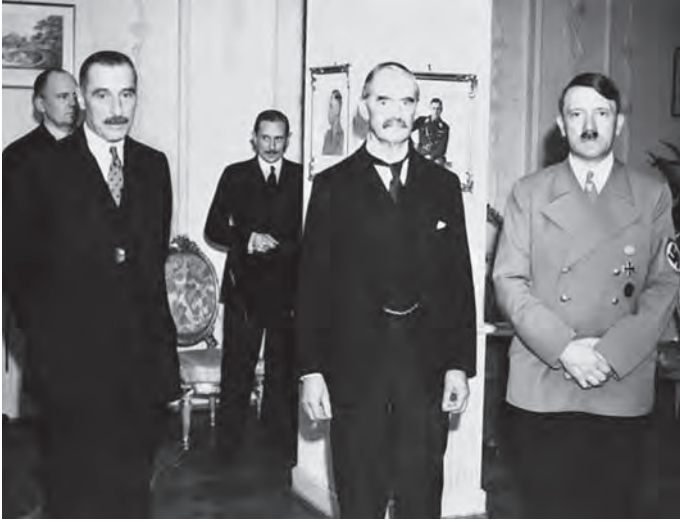
هتلر مع شامبرلن وهندرسون السفير البريطاني.

كبحوا حريتهم العالية على الأحرار ثم أشبعوا نفوسهم المكبوحة بشهوة العدوان على حرية الناس. فكانوا خاسرين في الصفتين، غادرين بحرمتهم وحرمات من يعتدون عليهم. وبئس التعليم إن كان هذا الصنيع في حاجة إلى تعليم. إنما المعجزة أن تعلّم المرء الكرامة فلا يهدر حقوقه ولا يهدر حقوق غيره، وإنما الرجل الكريم كما قلنا في كتابنا عن سعد زغلول من «يسوءه أن يتعرض الآخرون لغضاضة مهينة كما يسوءه أن يتعرض هو لتلك الغضاضة، ويعاف الذل حيث كان ولو لم يمسه في كبريائه، وذلك هو الفرق بين الكرامة المحمودة والغطرسة الذميمة؛ فإن الغطرسة الذميمة هي التي تستريح إلى إذلال الآخرين ولا تغار على كرامة إنسان، وهي التي لا تميز بين الكبرياء بحق والكبرياء بباطل، ولا تلوم الناس لأنهم اعتدوا عليها مبطلين بل تلومهم لأنهم عرفوا لأنفسهم كرامة ولو كانت صادقة وعلى صواب؛ ولهذا يستخذي المتغطرس حين تصدمه القوة من سواه، ولا يزداد الكريم إلا انتصارًا لكرامته حين يمسه من يتناول عليه».