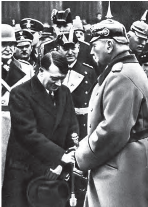
هتلر بين يدي هندنبرج.