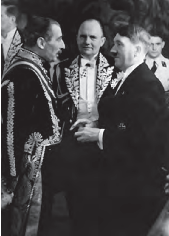
هتلر مع السفير البريطاني.

وقد جمعنا في هذه الصفحات صورًا عدة لهتلر وهو يخطب، أو وهو يغضب؛ لأنه في الحقيقة قَلَّمَا يخطب إلا ليغضب. فأية صورة من تلك الصور يا ترى يستطيع القارئ أن يكتب تحتها مثلًا: «هذه صورة هتلر يزأر أو يزمجر؟» إن هذا الكلام لِيُكْتَب تحت صور كثيرة لمصطفى كمال أو لسعد زغلول، ولكن هتلر — على عنايته بصوره واتخاذَه رسامًا خاصًا يتبعه في جميع المحافل ويوزع في أقطار العالم ألوف الصور بل عشرات الألوف منها — لا توجد له صورة واحدة تُخَيَّل