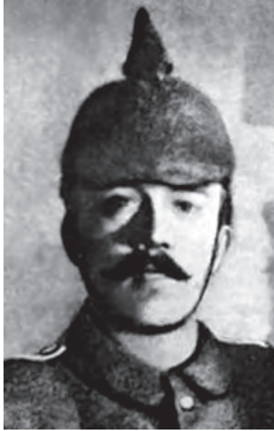
هتلر كما كان في الحرب الماضية.