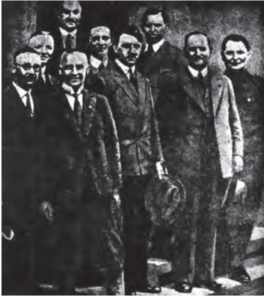
هتلر وأصحابه قبل زهو النجاح.