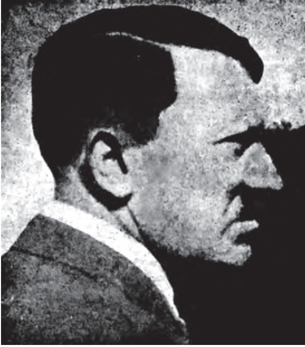
هتلر في نوبة سوداء.