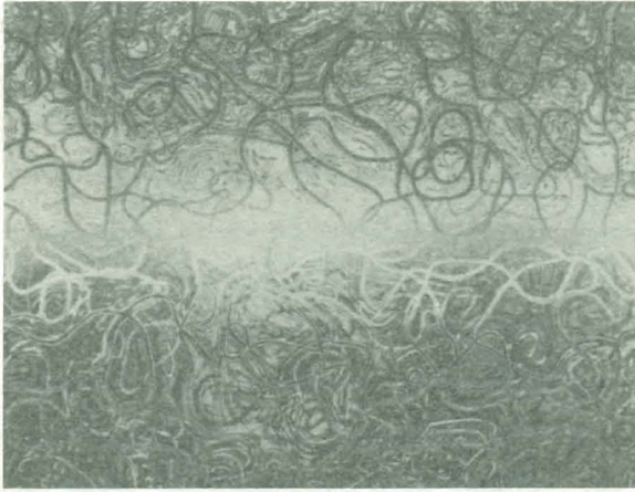
شكل ٢: عمل فني متطور. حقوق الملكية محفوظة لكارل سيمز Karl Sims، واستخدمت بناءً على تصريح منه.

تنازل أسلوب دوكينز في فهم التطور عن مسئولية التوليد للحاسوب الذي يغير عشوائيًا (وليس عمدًا) الفرد المنتخب، ويحتفظ الفنان فقط بحق فحص هذه الأشكال المعدلة واختيار أيها سيُنسخ (بصورة خاطئة) إلى الجيل التالي.