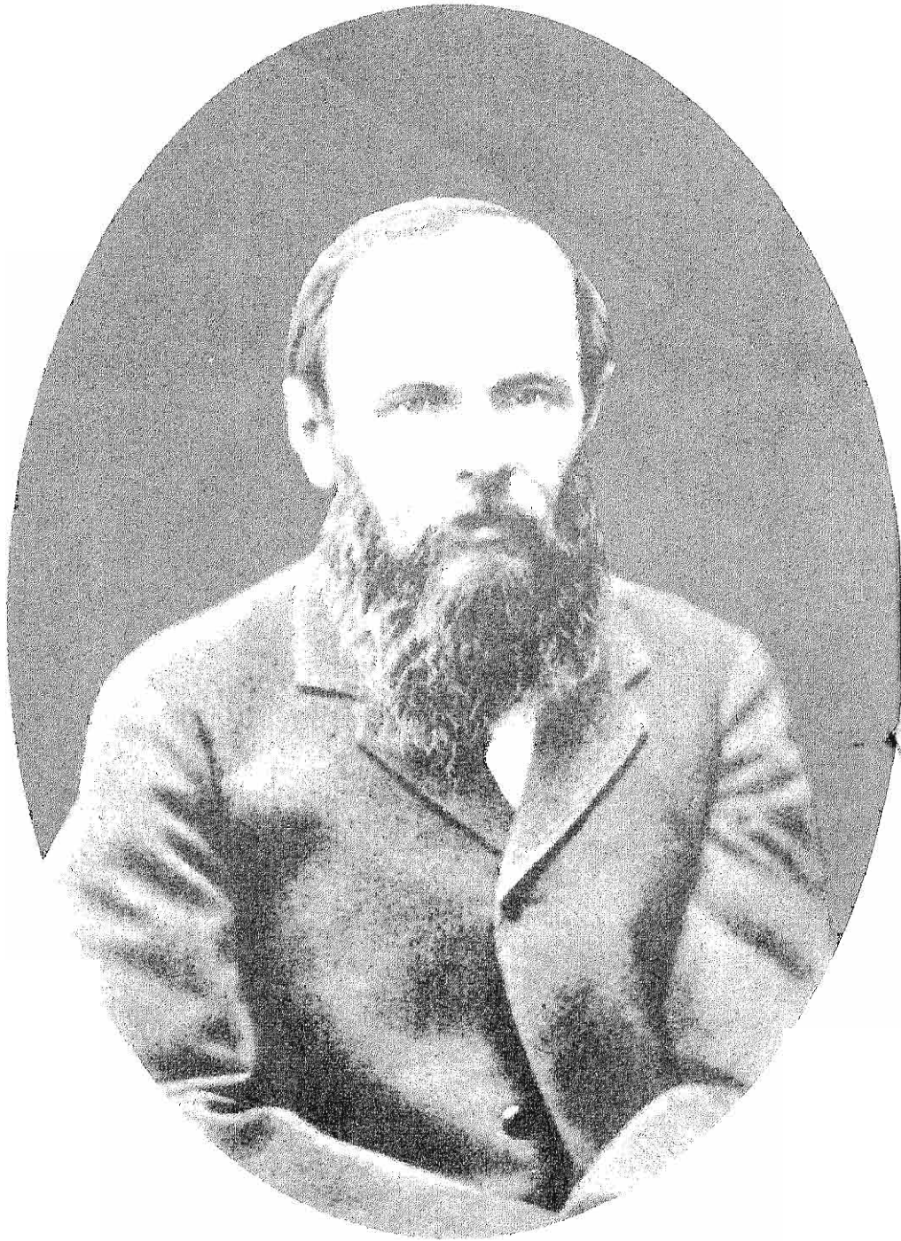
الانعمال الأدبية الكاملة المجلد الرابع عشر