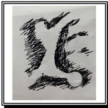
الشكل رقم (٢)