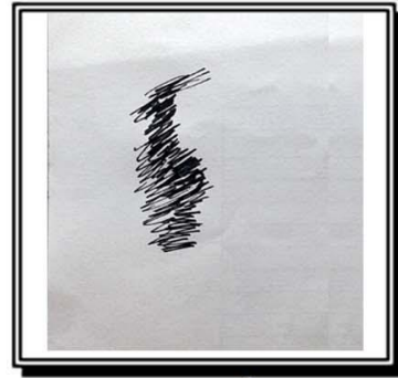
الشكل رقم (١)