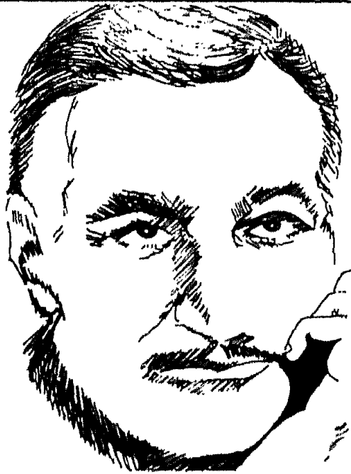
جمال عبد الناصر