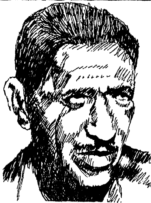
عبد الحكيم عامر