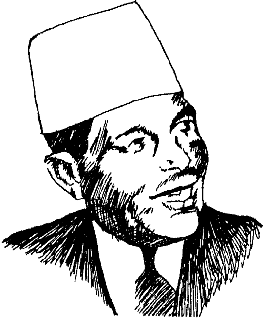
محمد محمود باشا