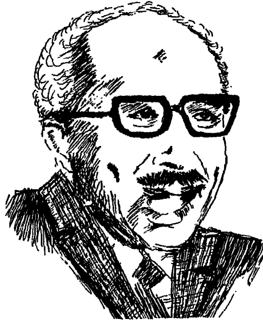
الرئيس الراحل أنور السادات