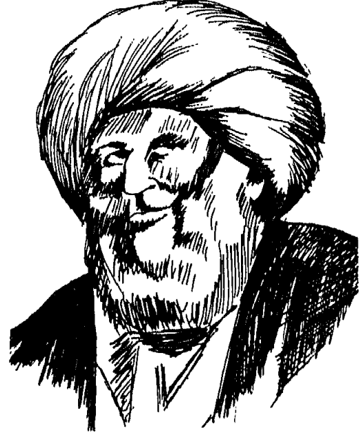
محمد علي باشا