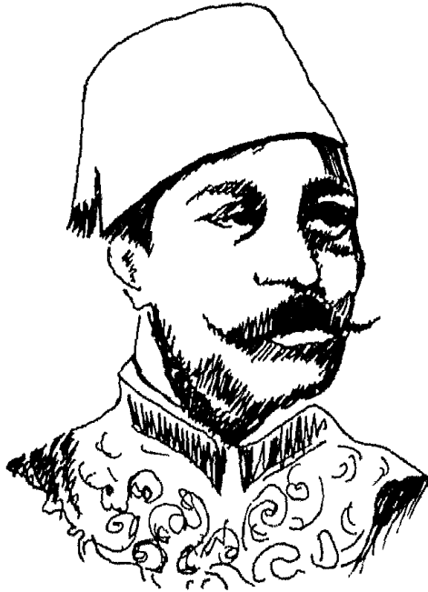
محمود سامي البارودي