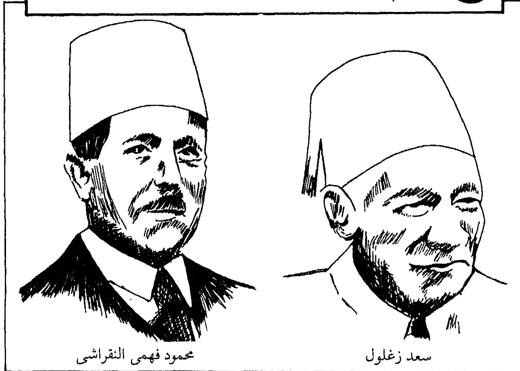
محمود فهمى النقراشى