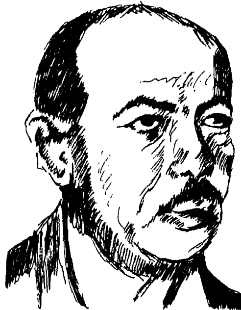
الفريق محمد فوزى