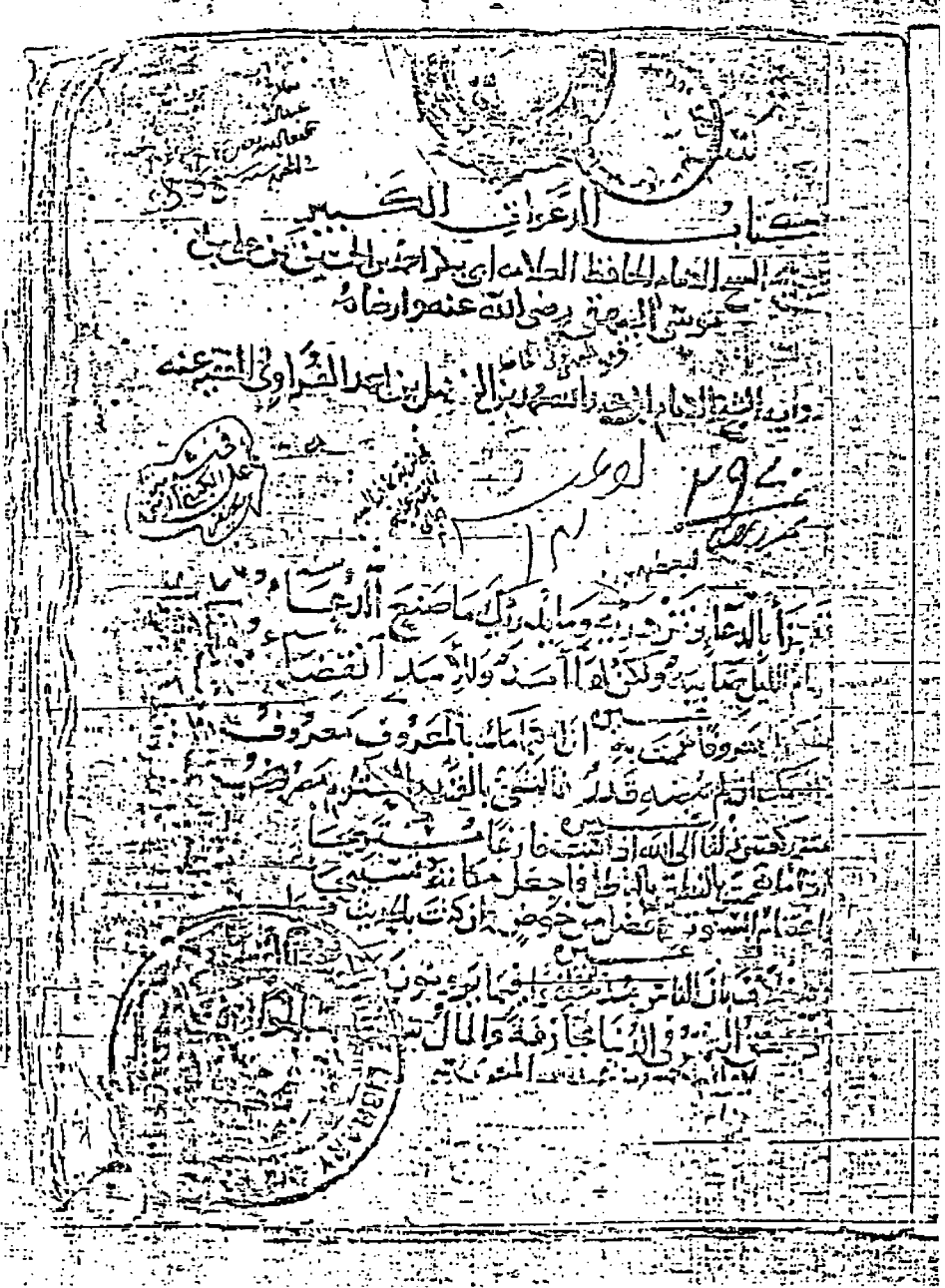
صورة الورقة الأولى من النسخة الهندية