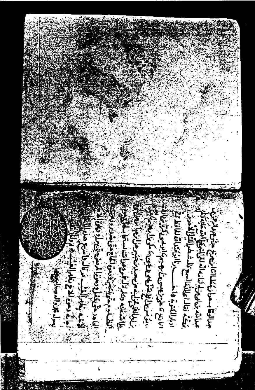
صورة الورقة الأخيرة من نسخة كتابية