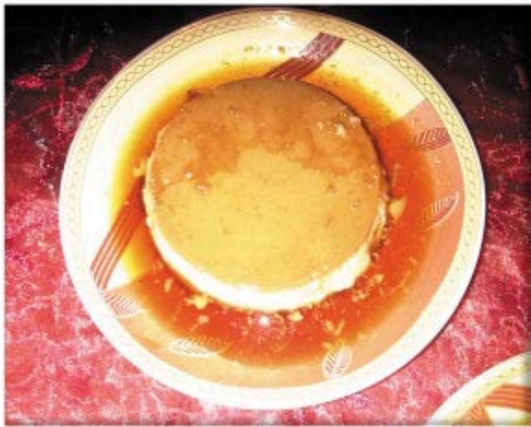
من صنف 'الحلويات'

لتر حليب 250 غرام سكر 6 الى 8 بيض فانيلا