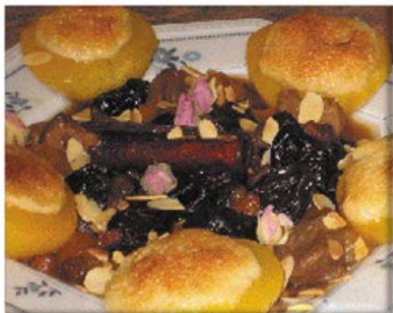
من صنف 'الحلو'