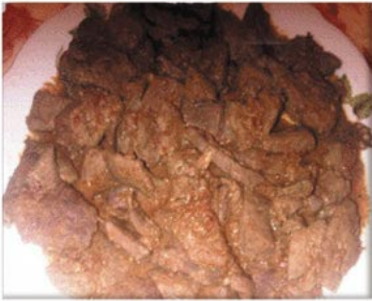
من صنف 'الأطباق الرئيسية'