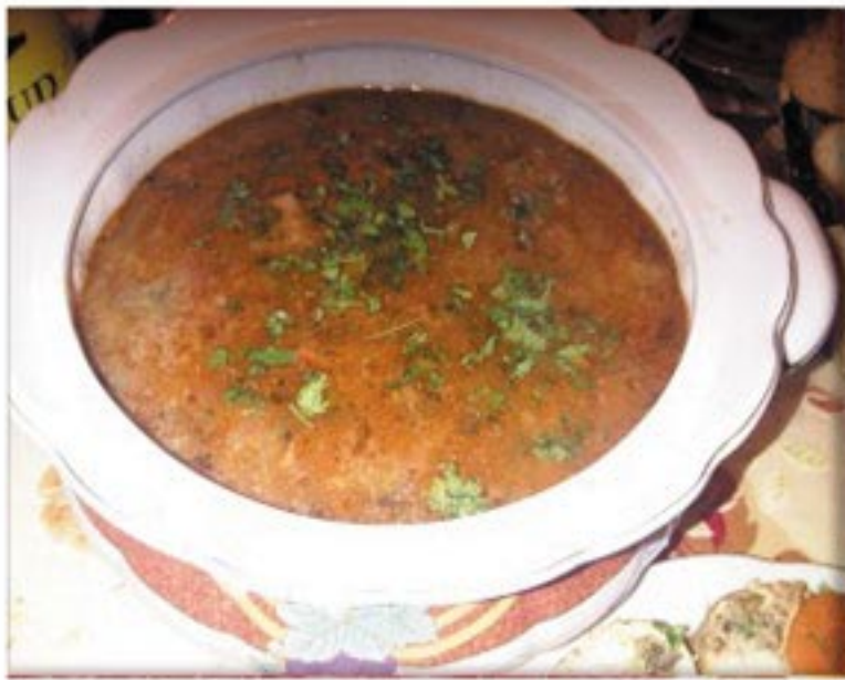
من صنف 'الشوربات'