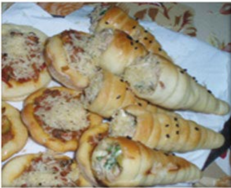
من صنف 'العجنات'

عجينة عشر دقائق تونة مايونيز بصلة صغيرة بققدونس زيتون أخضر جبن طري ملح فلفل أسود كزبرة ناشفة حبة البركة جبن مبروش