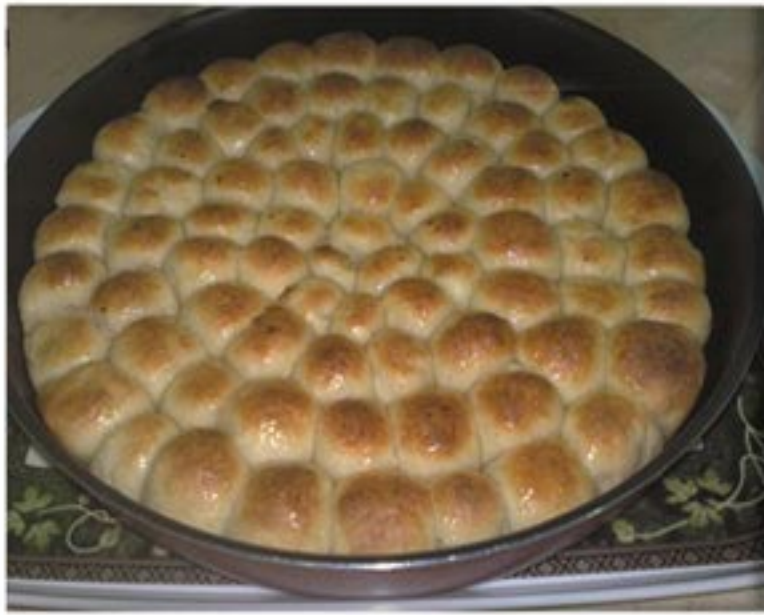
من صنف 'العجنات'

كوبين دقيق 3 ملاعق حليب بودرة كوب ماء ملعقة كبيرة سكر ربع ملعقة متوسطة ملح ربع كوب زيت ملعقة متوسطة خميرة ملعقة متوسطة بيكنج بودر شيرة