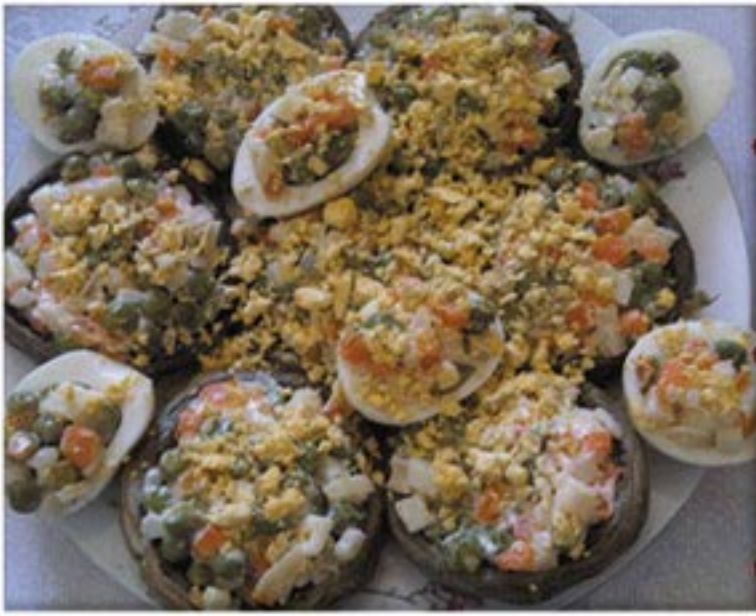
من صنف 'السلطات'