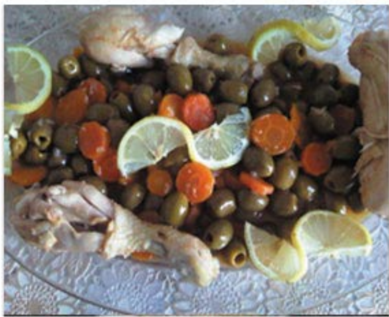
من صنف 'الأطباق الرئيسية'