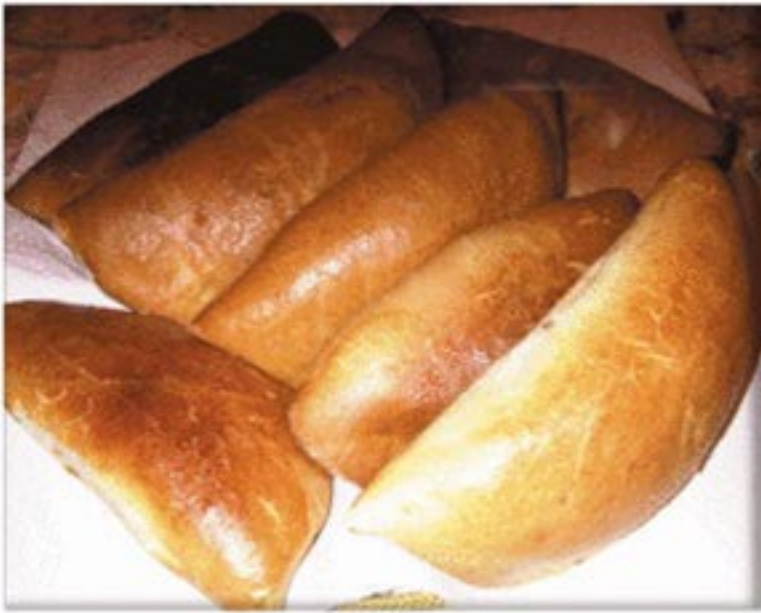
من صنف 'العجنات'