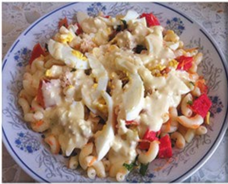
من صنف 'السلطات'