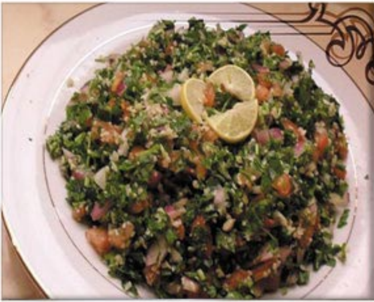
من صنف 'السلطات'