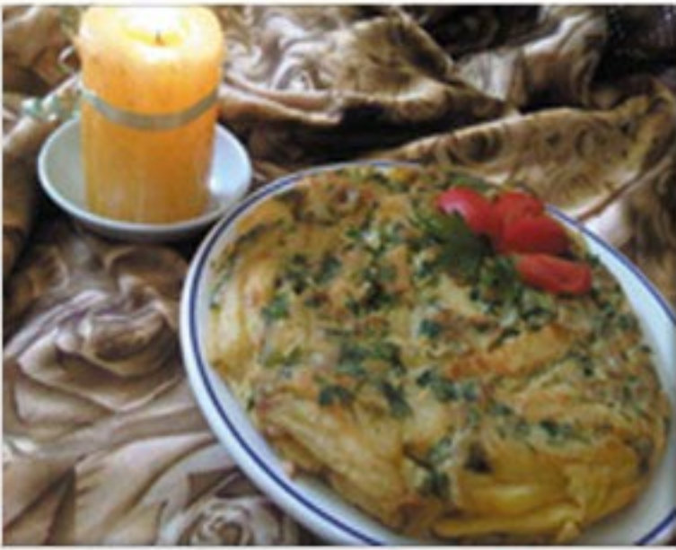
من صنف 'القبيلات'