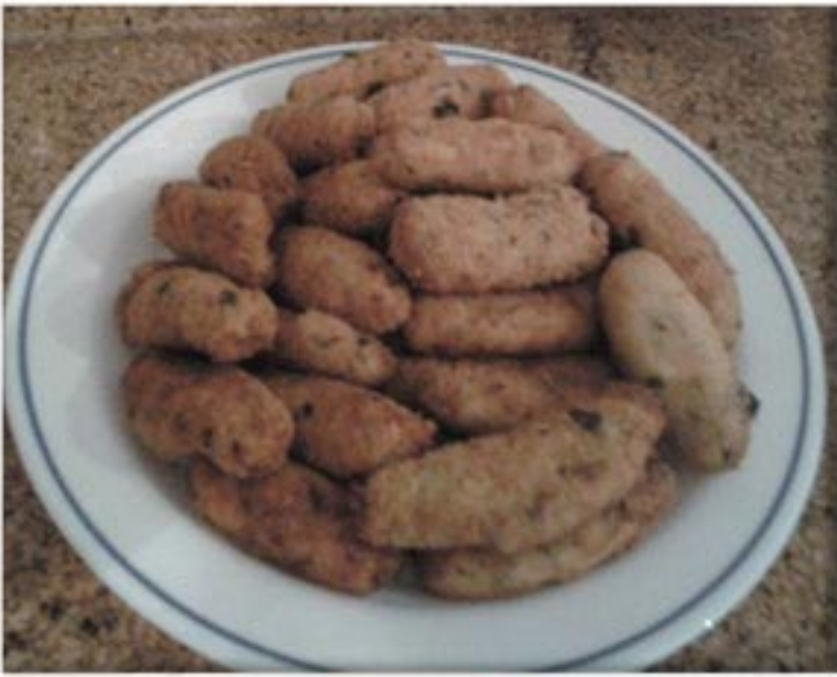
من صنف 'القبيلات'

صدر دجاج جبين شيدر بقدونس باشميل ملح فلفل أسود بهارات