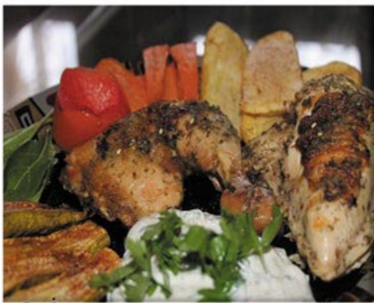
من صنف 'الأطباق الرئيسية'

دجاج مع العظم زبده زعتر بري ليمون ملح و فلفل اسود للصلصة: 2 علبة زبادي 2 ملعقة طحينه ملعقة مايونيز ملح ليمون بققدونس ثوم