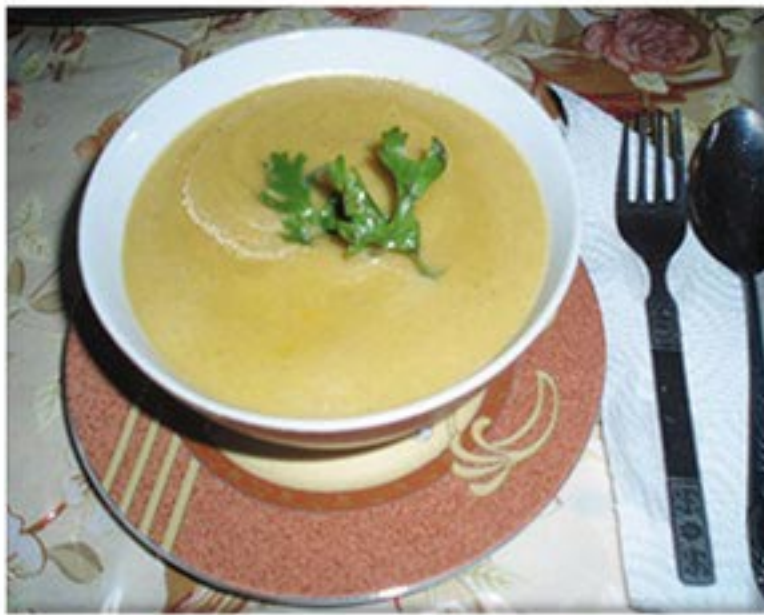
من صنف 'الشوربات'

قطع لحم حبة بطاطا 2 حبة جزر 2 حبة لفت حبة بصل عود كرفس ملح فلفل اسود كزبرة ناشفة كريمة ( اختياري ) ملعقتين زيت