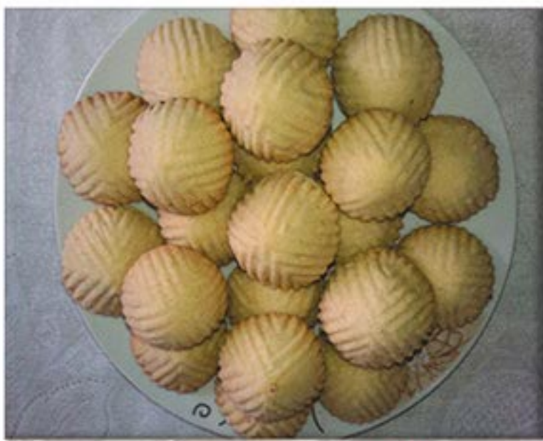
من صنف 'المحليات'

ربع كيلو تمر معجون 2 ملعقة سمس (جلجلان) محمص و مطحون ملعقة كبيرة ماء زهر ملعقة كبيرة زيت