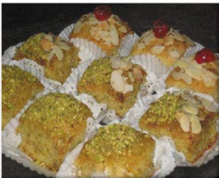
من صنف 'المحليات'