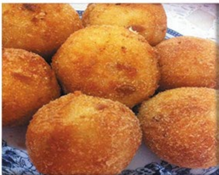
من صنف 'القبيلات'

3 حبة بطاطا ملعقة زبدة جبن طري ملح و فلفل أسود رشة بابريكا لحم مفروم حبة بصل حبة طماطم فص ثوم بهار زيت بيض طحين بقسماط