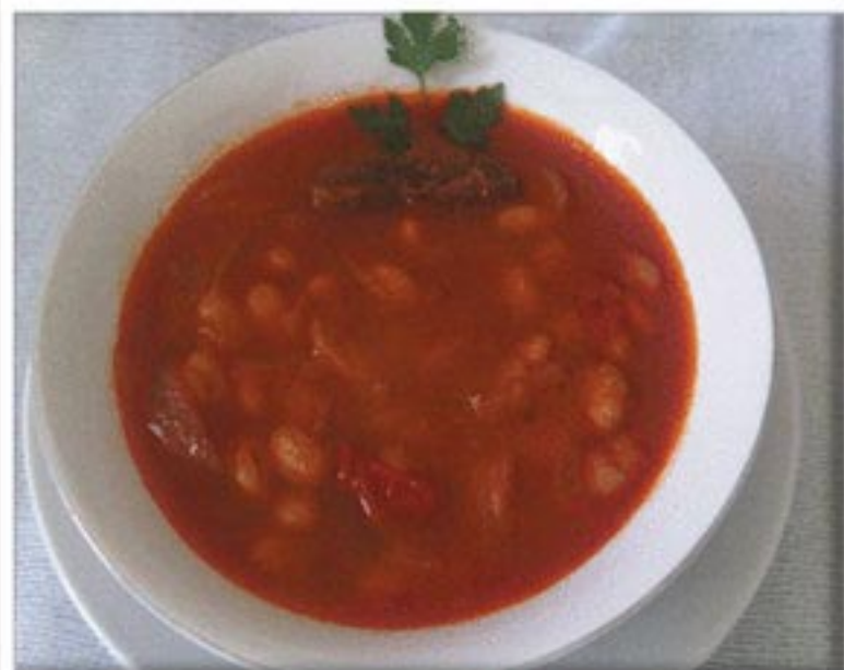
من صنف 'الشوربات'