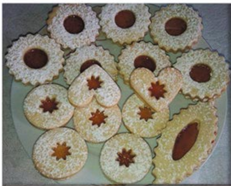
من صنف 'المحليات'