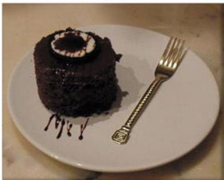
من صنف 'الحلويات'

بسكوت اوريو خلطه بيتي كروكر بالشكولاته زبدة 6 جلاكسي 2 قشطة هيرشي بالشوكلاته