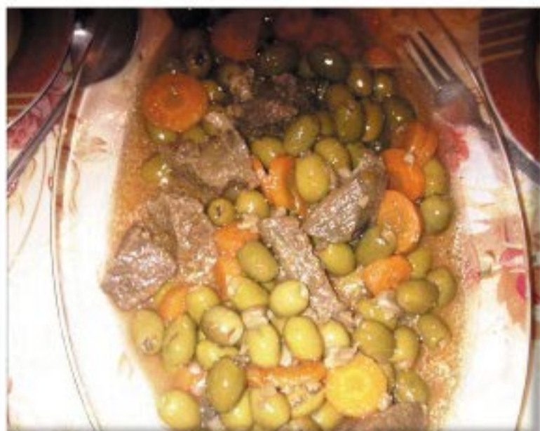
من صنف 'الأطباق الرئيسية'