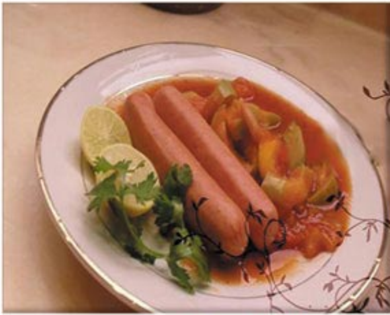
من صنف 'الأطباق الرئيسية'

نقانق مجمد خضار مشكلة جزر بطاطس فاصوليا بهارات ملح، فلفل، كمون بصل طماطم صلصلة الطماطم