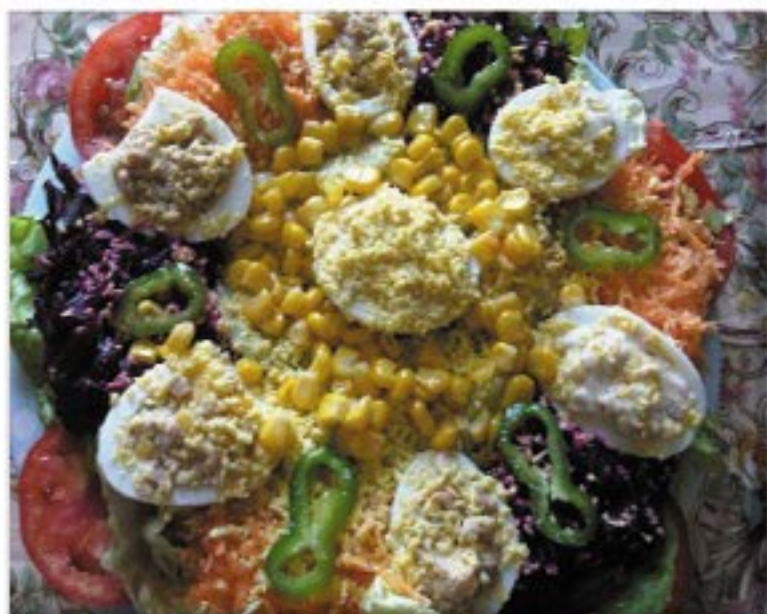
من صنف 'السلطات'