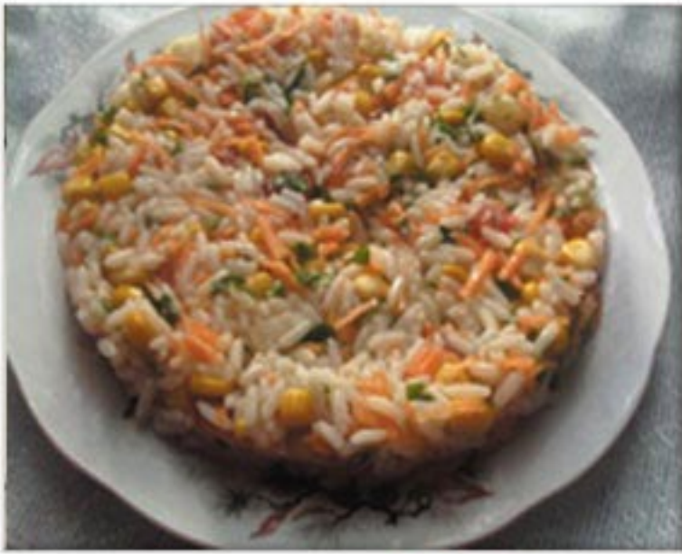
من صنف 'السلطات'