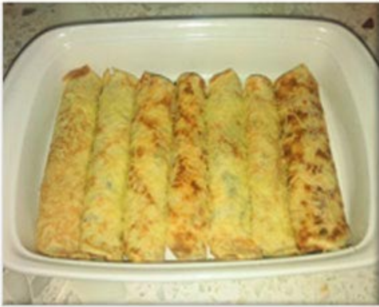
من صنف 'العجنات'