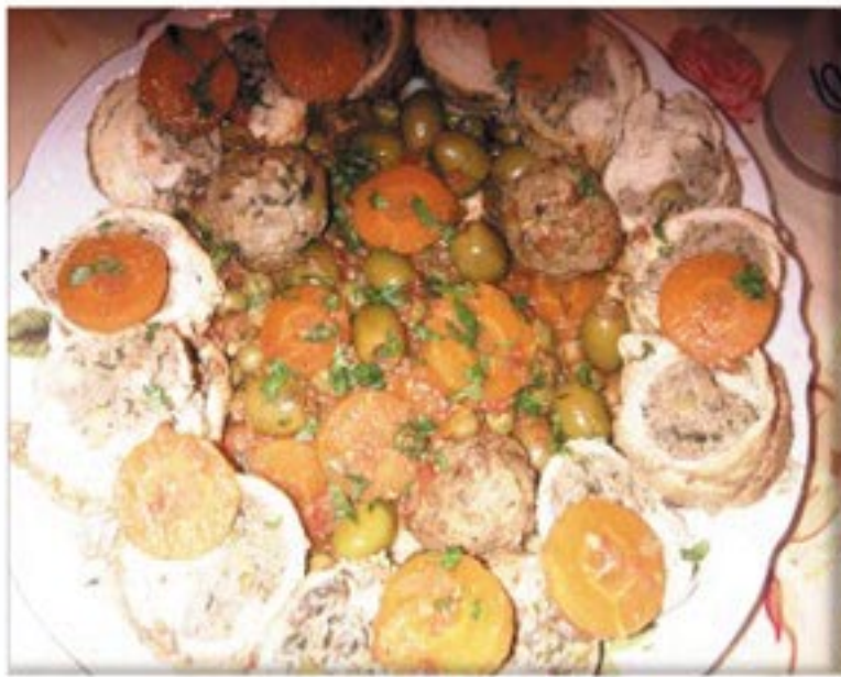
من صنف 'الأطباق الرئيسية'