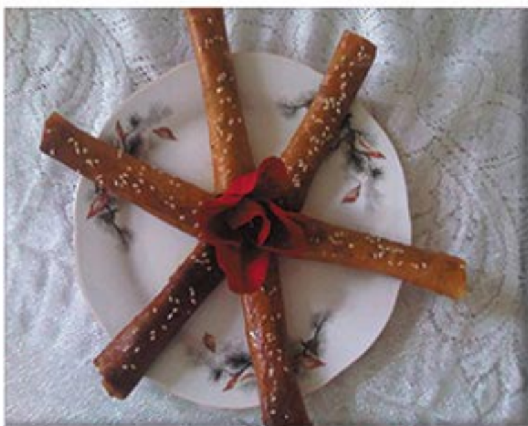
من صنف 'المحليات'