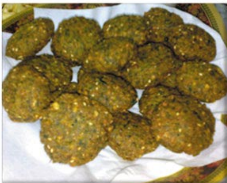
من صنف 'القبيلات'