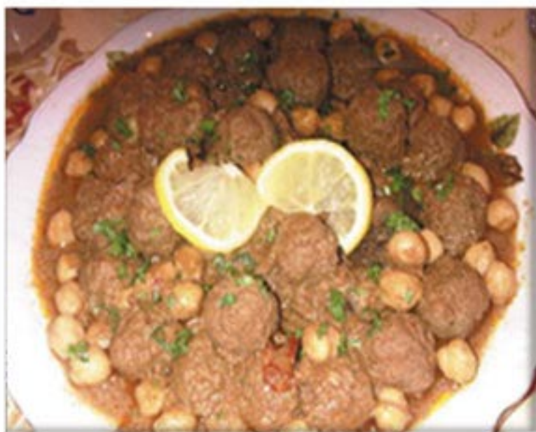
من صنف 'الأطباق الرئيسية'