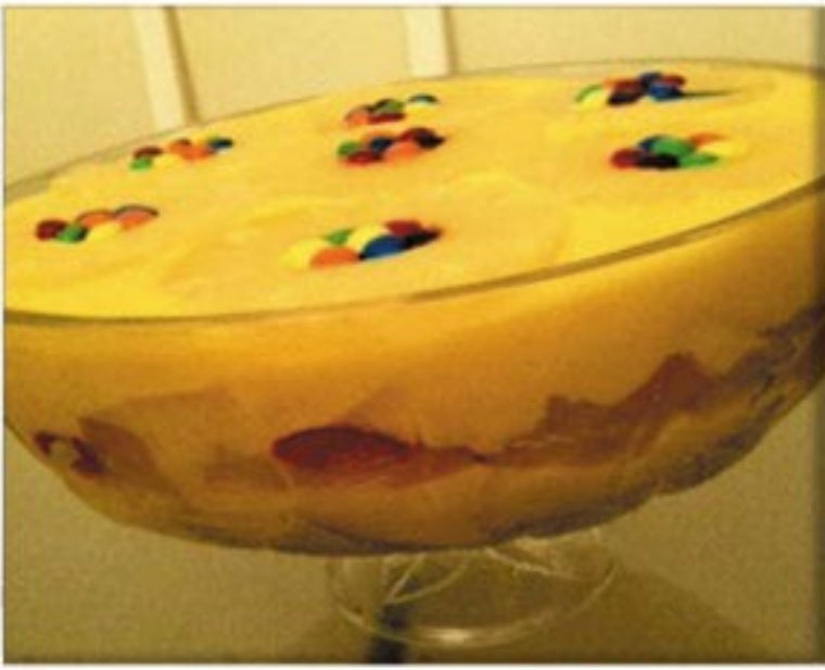
من صنف 'المحليات'