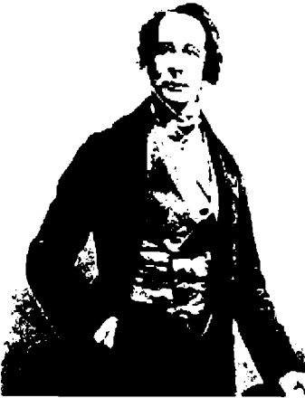
الروائي ديكنز (١٨٥٢)

وفي نيسان/ أبريل سنة ١٨٣٦ تزوجها. وكانت لها شقيقتان، ماري وجورجينا، ارتبطتا كلاكهما ارتباطاً غريباً بهذا الزواج، ونتيجة لذلك انتشرت ظنون وشائعات حول نوع من الحب الشهواني العاصف بينه وبينهما. عاشت ماري مع الزوجين الشابين منذ البداية الأولى للزواج وماتت فجأة في ريعان الصبا بين ذراعي تشارلز، تماماً كما ماتت «نيل ترينيت». والتحقت جورجينا بالأسرة بعد ذلك بوقت قصير، والذي يعث على الاستغراب حقاً أنها بقيت هناك حتى بعد أن حُرمت كاترين من صفتها كزوجة. كانت كاترين الابنة الكبرى