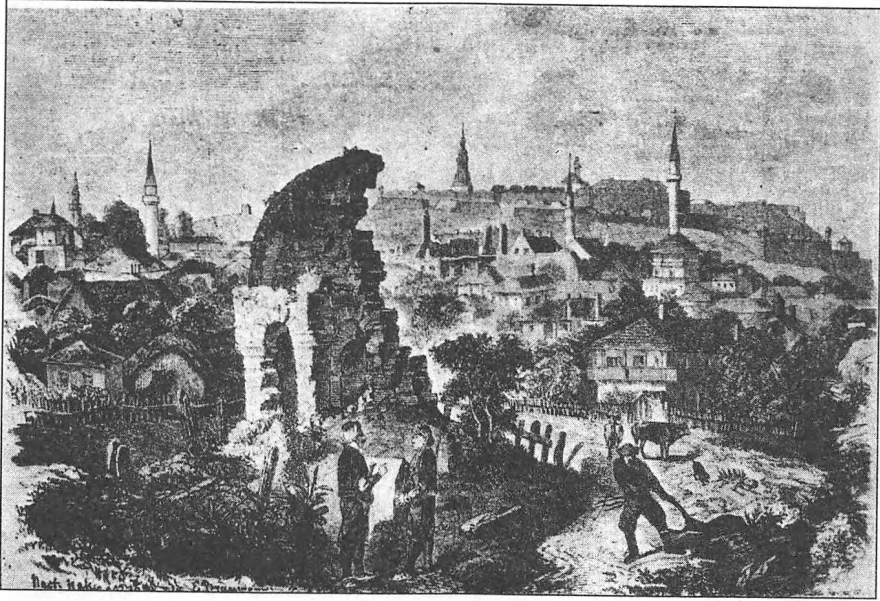
لوحة تمثل ما بقي من بلغراد العثمانية في ١٨٤٦ م.

مما جعل عدد المسلمين في بلغراد يتناقص بسرعة لتصبح بالتدريج «مثل المدن الأوروبية الأخرى» (١) .